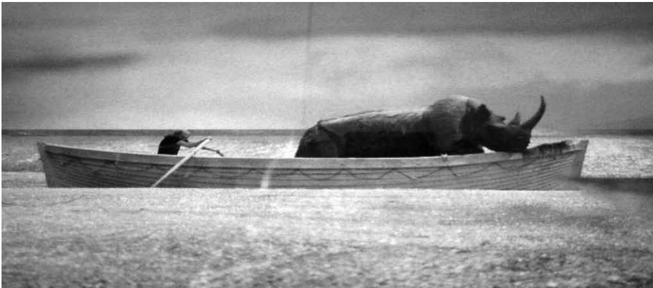
L'excentricité excessive de Fellini : « E la nave va » - dimanche à la Cinémathèque.