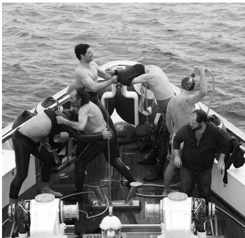
Funny games played on a fishing boat: "Chevalier" - at Utopia as part of the Cinéclub hellénique.