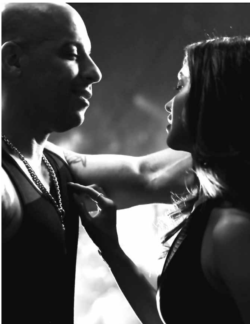
Geheimdienstarbeit, wie sie sich wahrscheinlich auch Donald Trump vorstellt: „XXX 3 - The Return of Xander Cage“ - in fast allen Sälen.