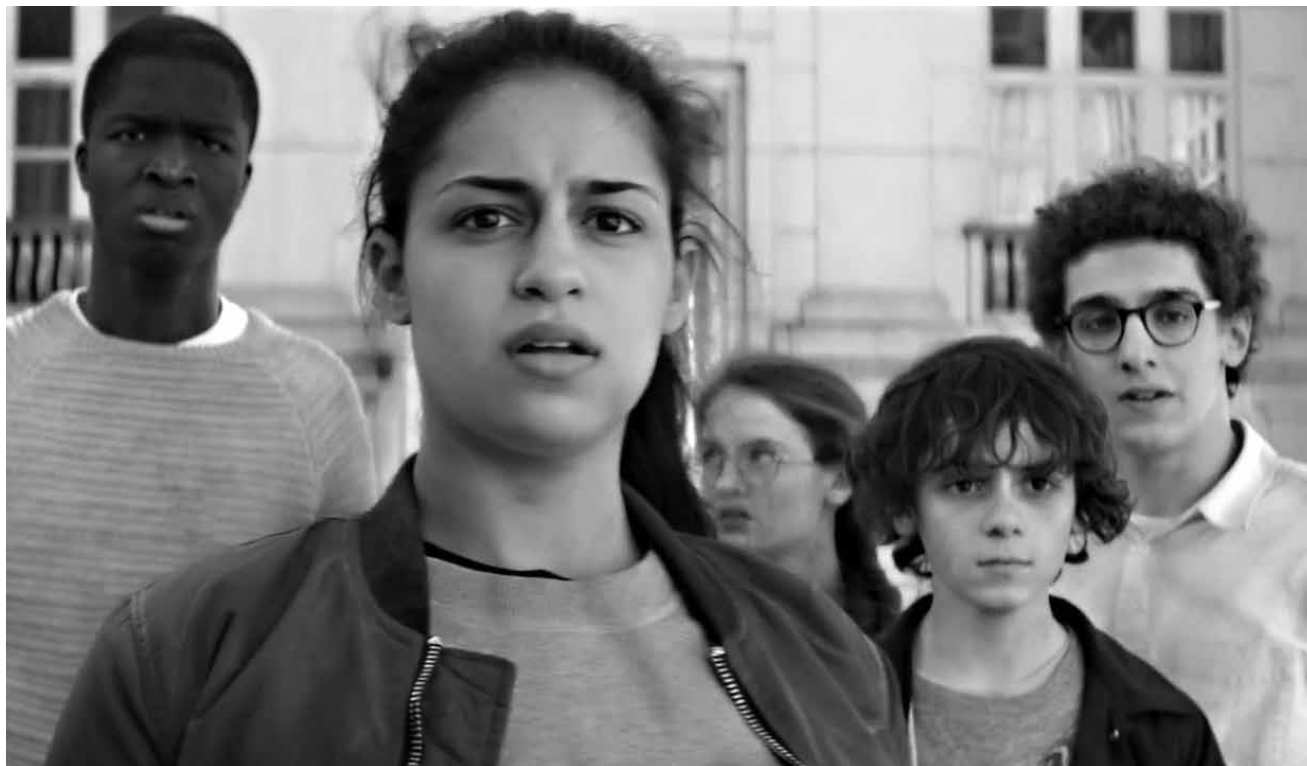
Quel bonheur de se retrouver enfin « Seuls » - l'adaptation cinématographique de la BD culte est à l'affiche à l'Utopolis Kirchberg.

Koala Buster Moon leitet ein Theater, um das es nicht sonderlich gut bestellt ist. Als er merkt, dass er ohne Anstrengungen nicht aus den roten Zahlen kommt, ruft Buster kurzerhand zu einem Gesangswettbewerb auf. Gemeinsam mit seinem Freund Eddie einem schwarzen Schaf, lädt er zum Vorsingen. Unter den Teilnehmern des Wettbewerbs sind der rappende Jung-Gorilla Johnny,