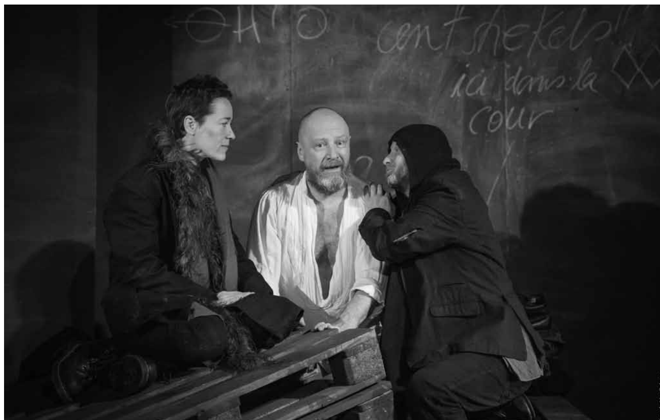
Amour, sexe, mort... bref que du solide dans « La putain de l'Ohio », au TOL les 10, 11, 12, 15, 16 et 17 février.

Hänsel und Gretel , Märchenoper von Engelbert Humperdinck, Theater, Trier (D) , 16h. Tel. 0049 651 7 18 18 18.