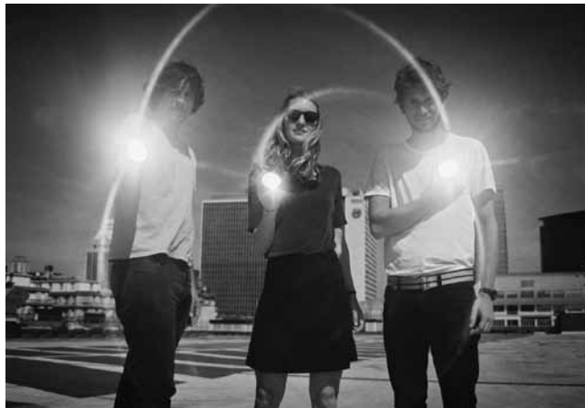
Oufiti ! Par deux fois du Belge : Konoba et Sonnfjord.