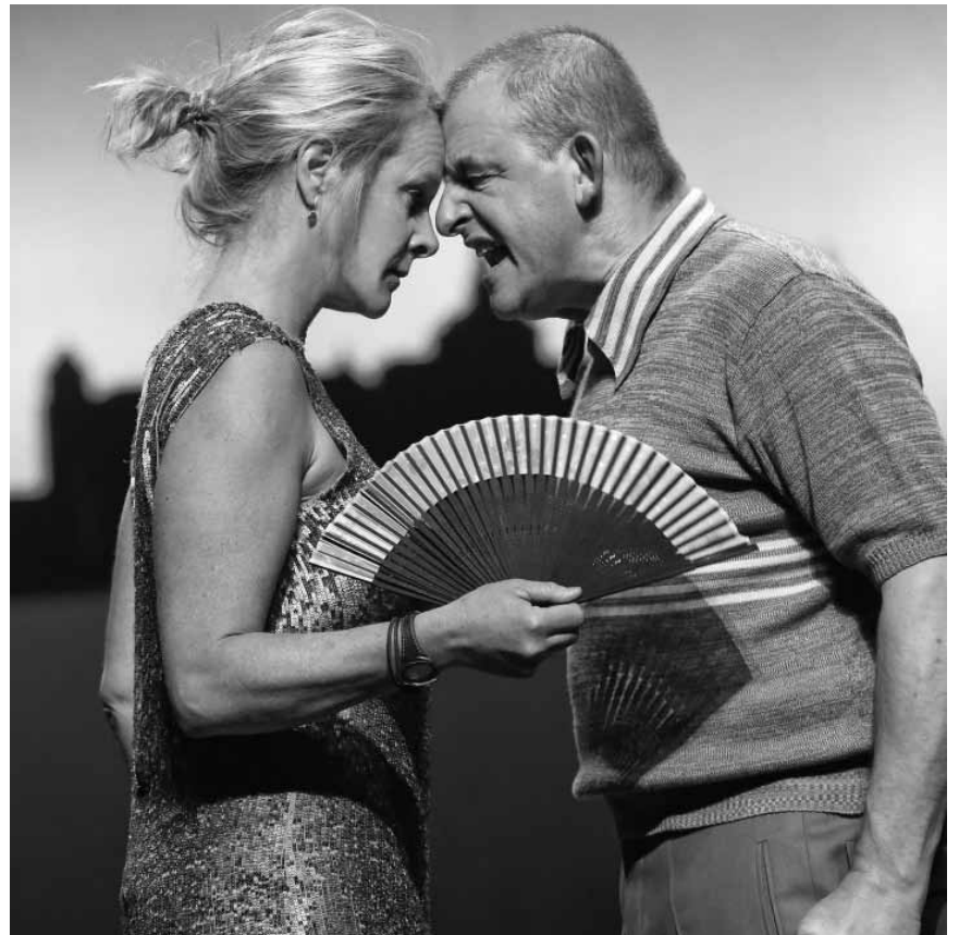
Das wünscht sich heutzutage so mancheR: „Das Leben ein Traum“ - nach Petro Calderon de la Barca und Pier Paolo Pasolini, am 10. Februar im Grand Théâtre.