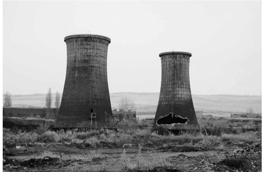
Le photographe hongrois Tamas Dezso est prêt pour l'apocalypse : « Notes for an Epilogue », jusqu'au 30 mars 2018 au Schlassgaart à Clervaux.