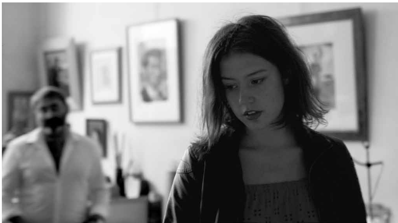
L'« Orpheline » au stade d'adolescente.