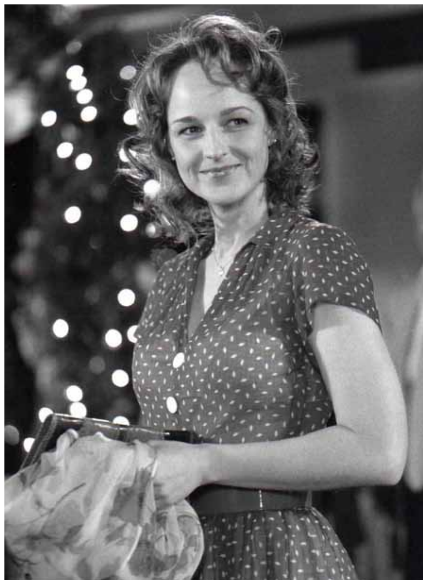
Nur Kellnerin Carol kann dem menschenverachtenden Neurotiker Melvin die Stirn bieten: „As Good as it Gets“, am 22. April in der Cinémathèque.

Sukie, Jane und Alexandra träumen in dem verschlafenen Eastwick von einem Märchenprinzen - doch der Fremde, der eines Tages auftaucht, ist selbstsüchtig, hemmungslos und widerlich. Trotzdem übt Daryl Van Horne eine seltsame Faszination auf die Freundinnen aus. Bald kommt es zu turbulenten Festen und wilden Orgien, wobei Daryl die intimsten Wünsche der Frauen erfüllt.