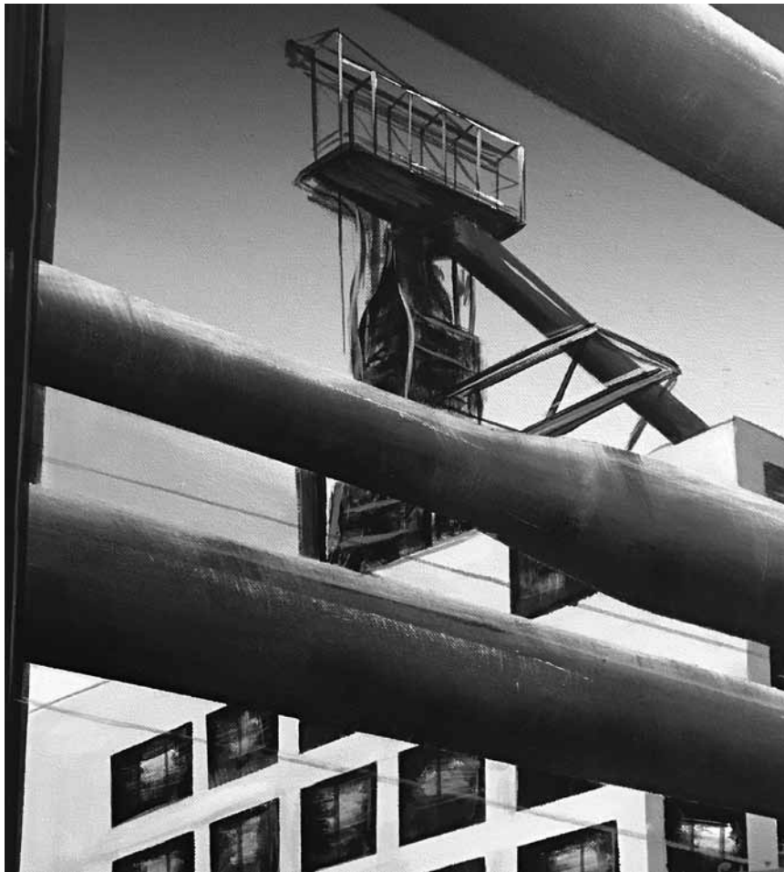
Encore et encore des hauts fourneaux... « Utopia », peintures et sculptures de Jhang Meis et de Rol Steimes, du 19 mai au 11 juin à la Schungfabrik à Tétange.

Visites guidées tous les sa., di. + jours fériés à 14h et 16h.