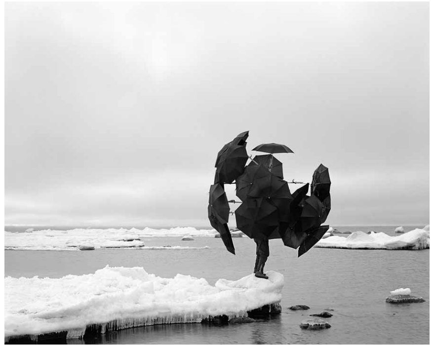
Völlig abgeschirmt von der Erde: „Sacred Bird“ - die Fotos von Janne Lehtinen können noch bis zum 18. September in den Arcades II in Clervaux bewundert werden.