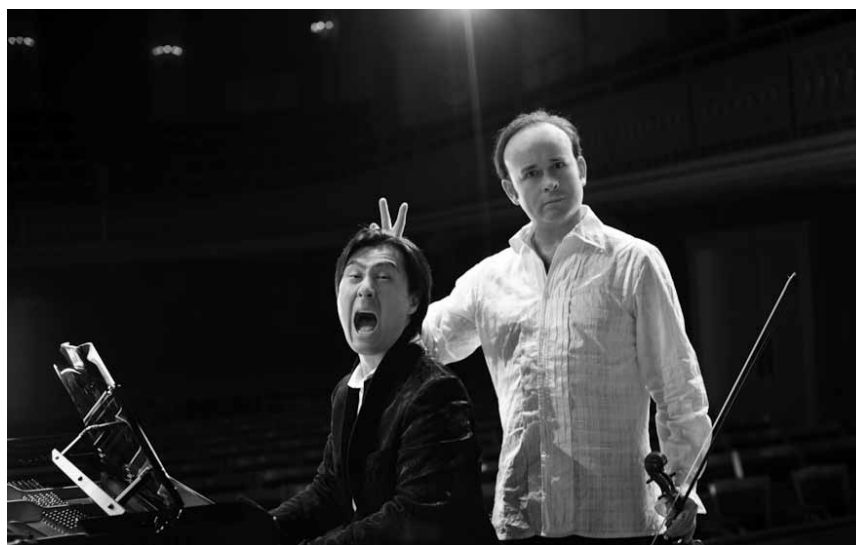
Wenn Humor und Klassik aufeinandertreffen: „And Now Mozart“ - am 19. Mai im Cape Ettelbrück.

Der Besuch der alten Dame , Tufa, Kleiner Saal, Trier (D), 19h30. Tel. 0049 651 7 18 24 12.