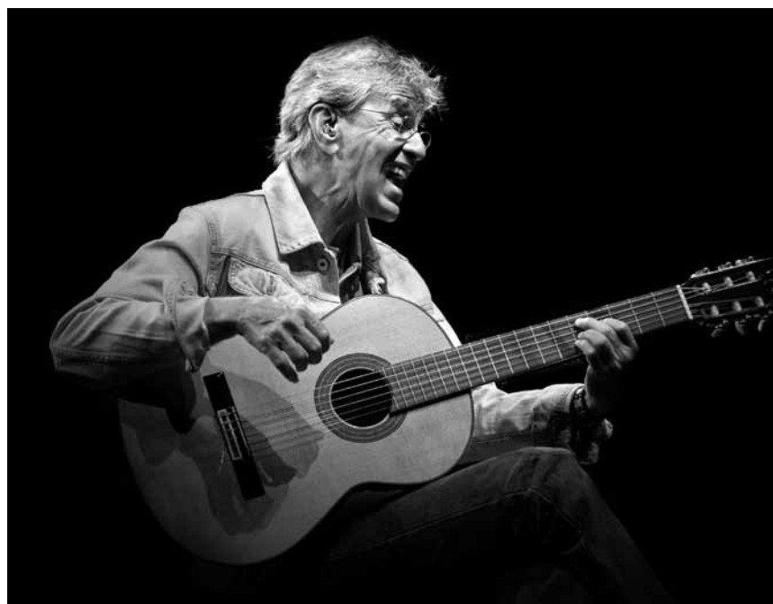
Caetano Veloso est une légende dans son Brésil natal - il passera à la Philharmonie le 14 mai.

Ro' Gebhardt, The Liquid (15, rue Münster), Luxembourg, 21h30. Tél. 26 20 52 98-1.