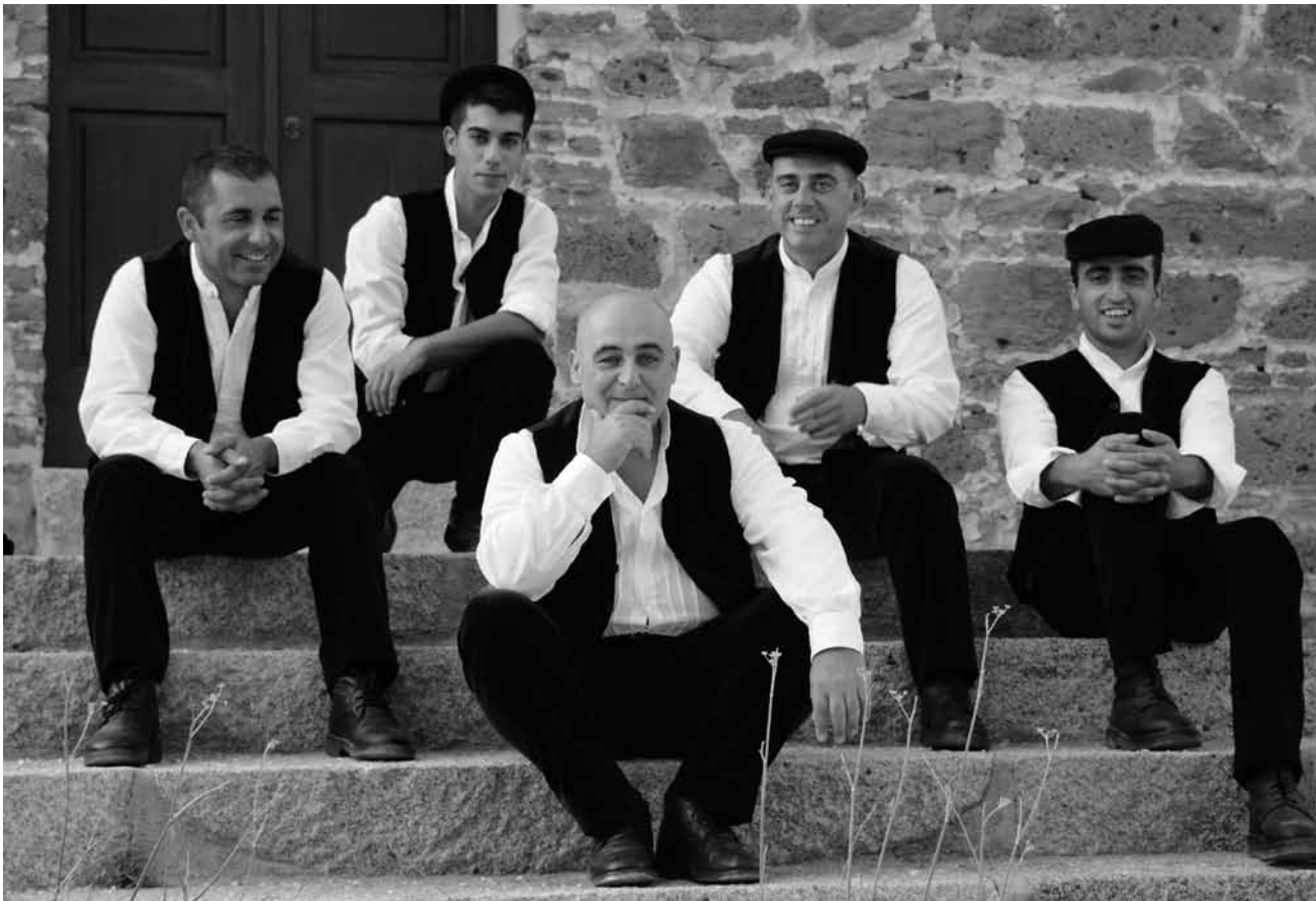
Le Cuncordu e Tenore de Orosei - musique traditionnelle de Sardaigne - arrivera à la chapelle Notre-Dame de Lorette à Clervaux le 21 mai.

Repair Café , halle Victor Hugo, Luxembourg, 14h - 17h.