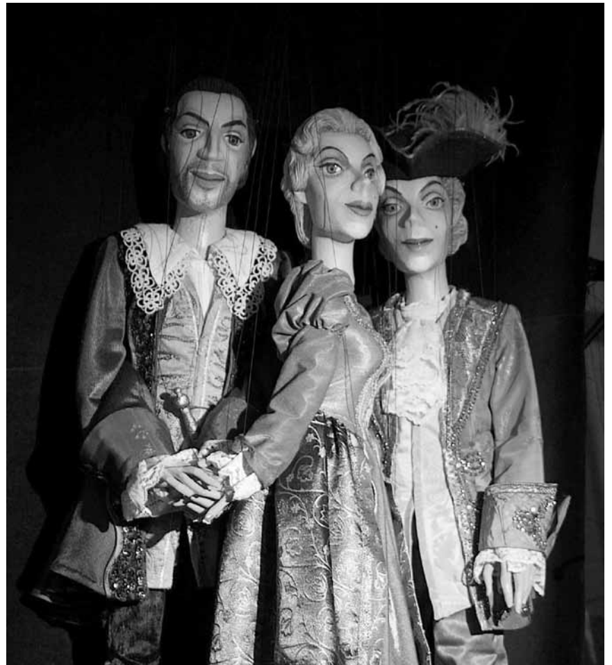
Am Wochenende werden in ganz Lasauvage wieder die Puppen tanzen - Das Festival „Les marionnettes sauvages“ dauert dort vom 12. bis zum 14. Mai.