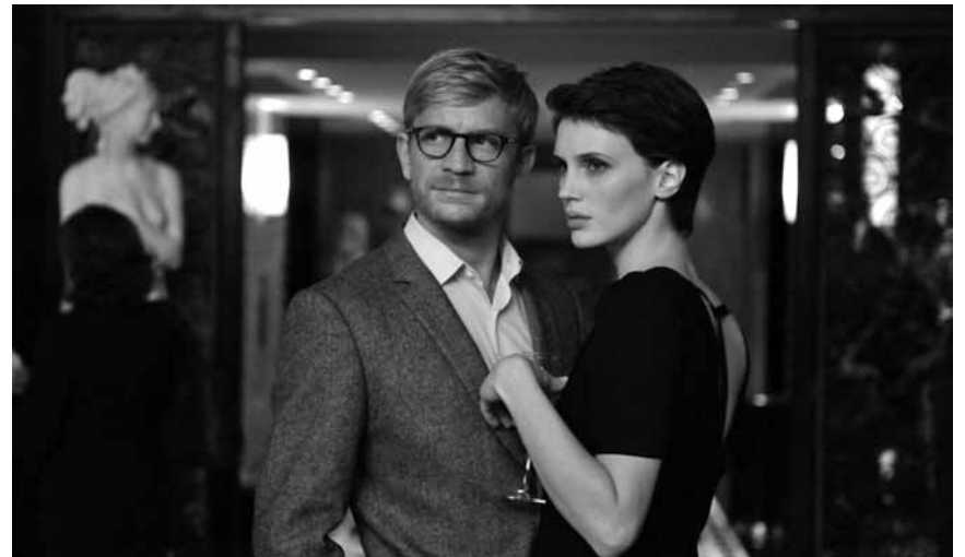
Une histoire d'amour pas comme les autres : « L'amant double » - le nouveau film de François Ozon est à l'Utopia et aux Kinepolis Belval et Kirchberg.

Hanni und Nanni werden von ihrer Mutter Susanne auf das Internat Lindenhof geschickt, da sie beruflich für längere Zeit verreisen muss und es dem Vater der Mädchen nicht zutrut sich um die Zwillinge zu kümmern, ohne dabei ein komplettes Chaos anzurichten. Hanni und Nanni finden das überhaupt nicht in Ordnung und planen, sich so danebenzubenehmen, dass sie noch während der Probezeit von der Schule fliegen. Doch dann hat Nanni plötzlich doch Spaß am Internatleben und die Zwillingsschwester sind nicht mehr ganz so unzertrennlich wie bisher.