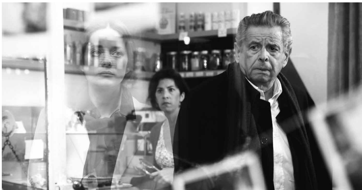
Les spectres du passé sont légion dans le nouveau Desplechin.