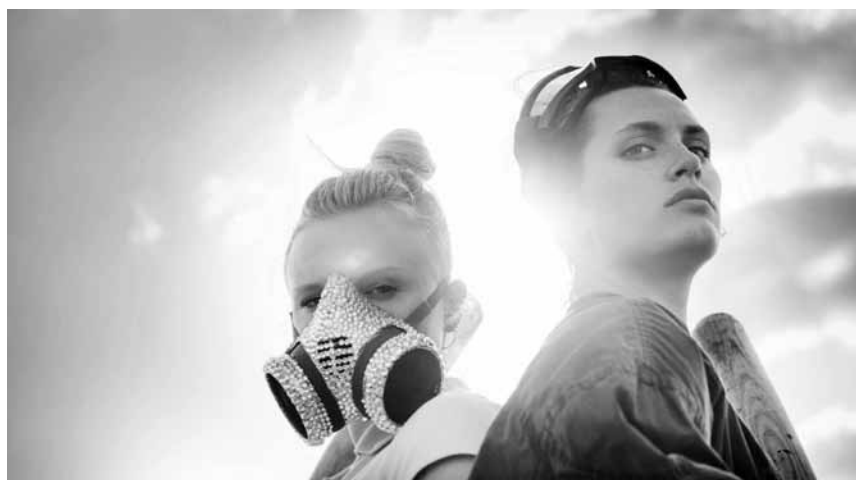
In „Tiger Girl“ geht es um Frauen, die auch manchmal hauen - im Utopia, im Rahmen des „Out of the Box“.