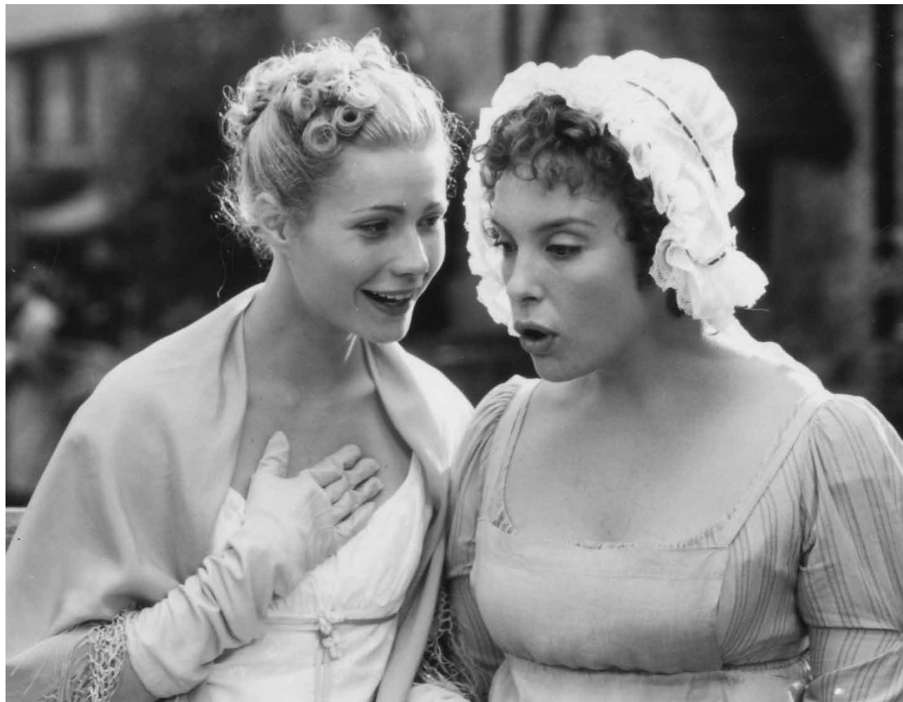
Probleme die wir zum Glück nicht mehr haben: in „Emma“ geht es um Dramas in der viktorianischen Upper-Class - am Samstag, den 10.6. in der Cinémathèque.

Une jeune Américaine débarque à Orly, parmi d'autres touristes, pour visiter Paris. Elle est conduite à son hôtel, un immense building de verre.