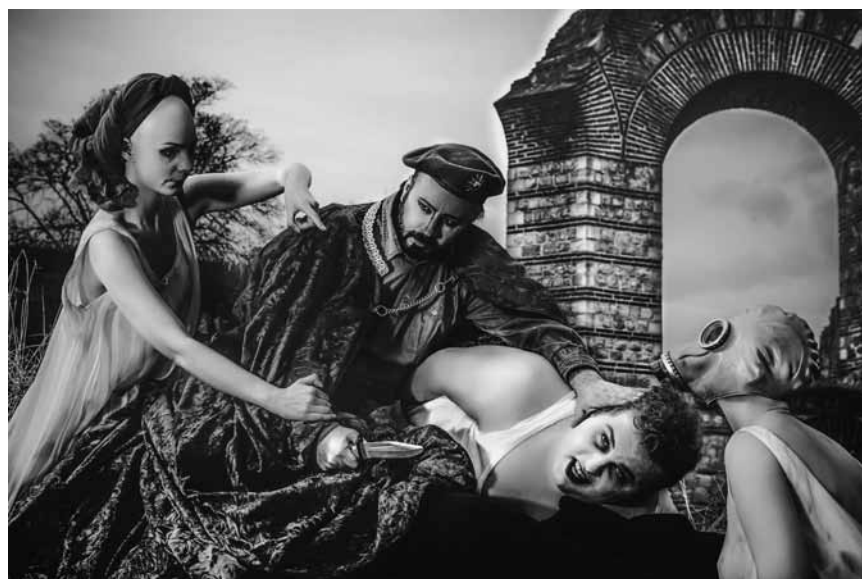
Mozarts Operndrama um den kretischen König Idomeneo, der seinen Sohn dem Meeressgott Poseidon opfern soll, am 10., 20., 23., 25. Juni und am 2., 6. und 9. Juli im Theater Trier.

Annika & the Forrest, café Konrad, Luxembourg , 21h.