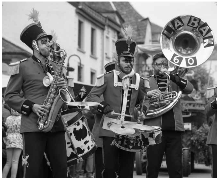
A séier erop an d'Éislek! Vum 2. bis den 5. Juni ass d'Geenzefest zu Woltz.

Bunbury (Ernst ist das Leben), Komödie von Oscar Wilde, Theater, Trier (D), 19h30. Tel. 0049 651 7 18 18 18.