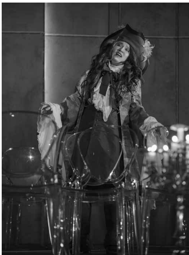
Baroque de bout en bout ?