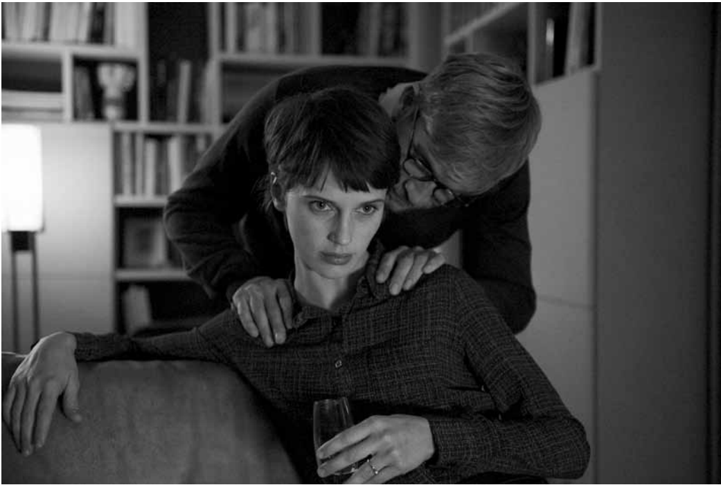
La question est : qui est en train de voir double ?