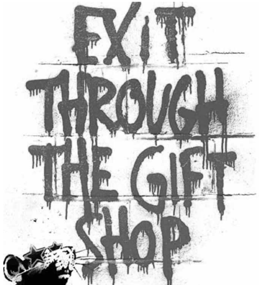
„Exit through the Gift Shop“ - eine Doku von und über Banksy, dem aktuell bekanntesten der anonymen Künstler - und vielleicht eine Inspiration für die hiesige Kulturpolitik: Am 13.6. im Kinosch.