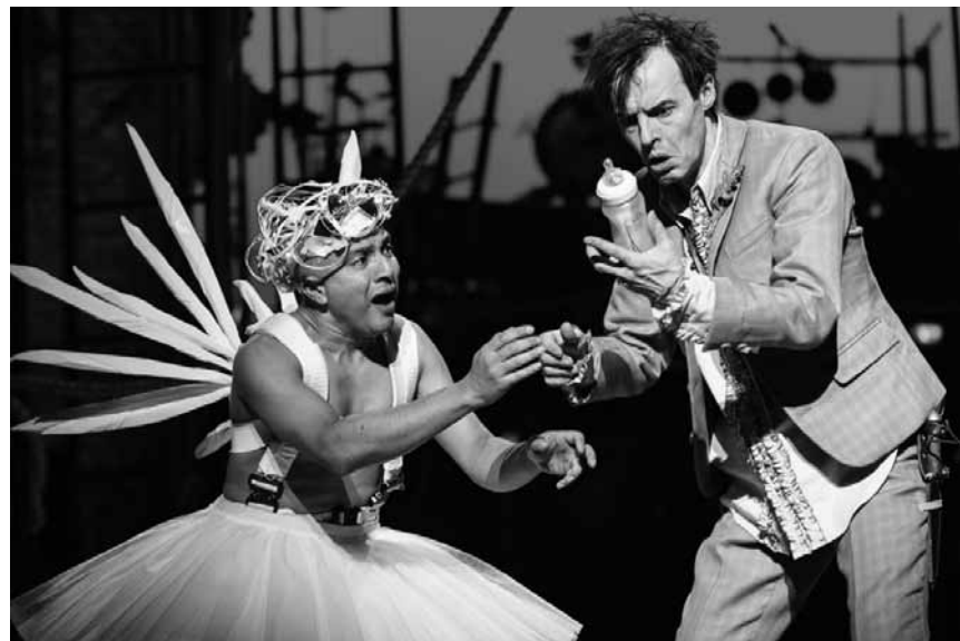
"Peter Pan" is back ... maybe because he never really went away: The play directed by Sally Cookson will be shown at the Utopia on June 10th at 6.30 pm.

Une histoire de famille au temps de la crise migratoire : « Comment j'ai rencontré mon père », nouveau à l'Utopia.