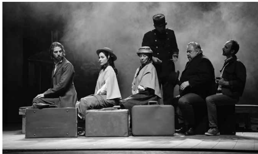
De Musical „E Living an Amerika“ erreicht dann lo och den héijen Norden - den 16. an den 17. Juni am Cube 521 zu Maarnech.

Fest vun der Natur , Info- und Verkaufsstände, Kinderaktivitäten und Bio-Vollwertküche, Haus vun der Natur, Kockelscheuer , 10h - 18h. Tel. 29 04 04-1.