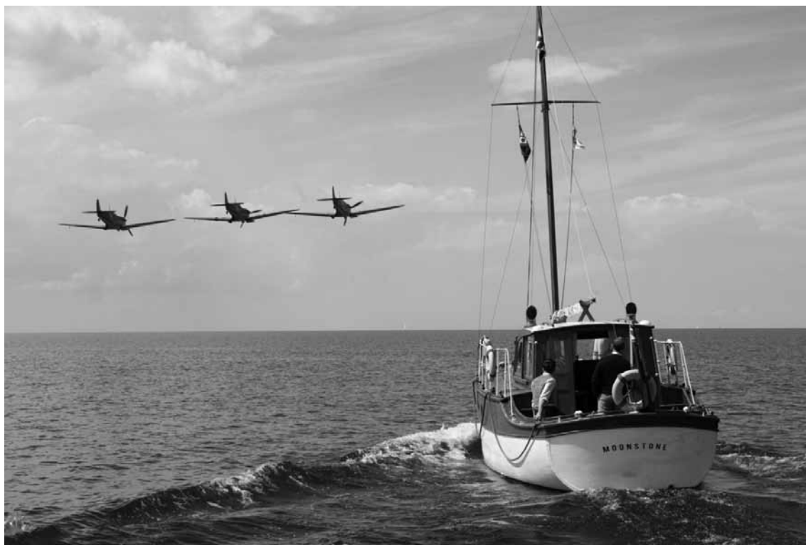
Un effort civil et militaire désespéré est au centre de « Dunkirk ».