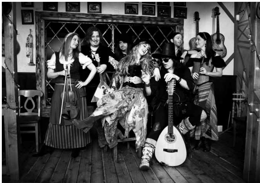
Renaissanceklänge von einem ehemaligen Deep Purple Gitarristen und seiner Frau - Blackmore's Night am 5. August in Vianden.