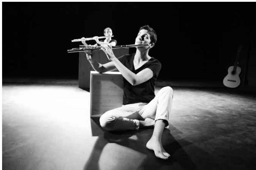
C'est le retour des programmes pour enfants aux Rotondes ! Avec notamment la Cie Pic et Colegram et leur spectacle « Tout pareil ! » - les 7, 8 et 10 octobre.

La bohème , Oper von Giacomo Puccini, Saarländisches