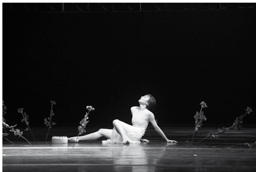
Tschaikowskys Vertonung von „Dornröschen“ mit einer Choreografie von Stijn Celis - zu erleben am 7. und am 15. Oktober im Saarländischen Staatstheater in Saarbrücken.

Nathan oder das Märchen von der Gleichheit , nach Gotthold Ephraim Lessing, Saarländisches Staatstheater, Saarbrücken (D) , 19h30. Tél. 0049 681 30 92-0. www.staatstheater.saarland