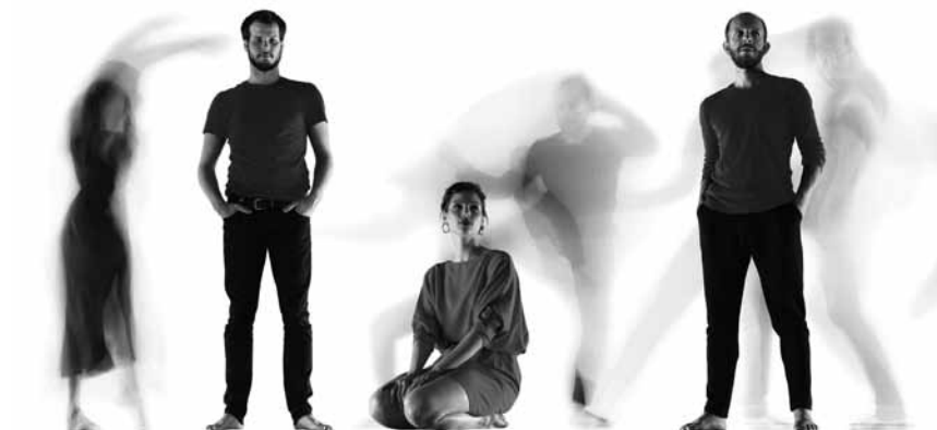
Pas une, pas deux mais « Trois fois danse » - le 14 octobre au Mierscher Kulturhaus.