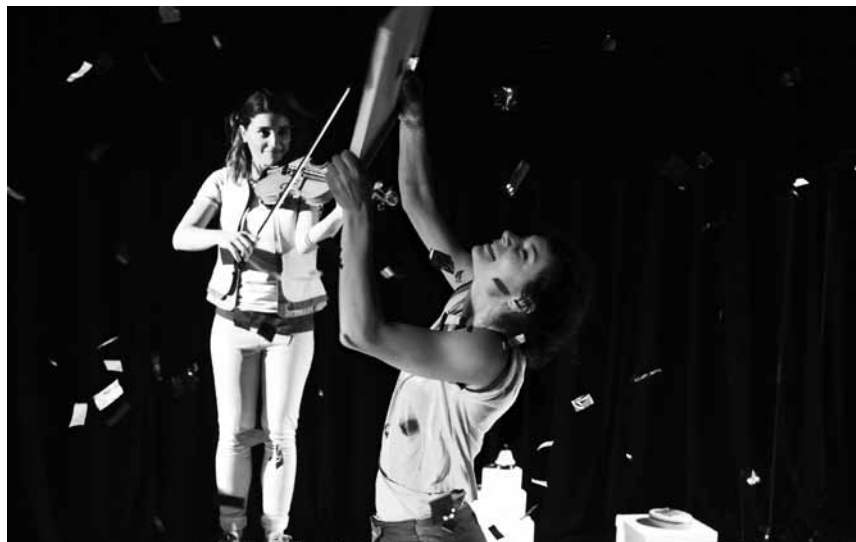
Das „Goldmädchen“ - ein Tanzstück unterlegt mit Melodien von Vivaldi, Stravinsky und Bach - zieht durchs Land: am 14. Oktober im Mamer Kinneksbond und am 15. Oktober im Trifolion in Echternach.

Munderchinga Brass & Friends , mat den Organisten Claude Clement, Philippe Clement a Léon Marx an de Blechbléiser a Percussioniste vun