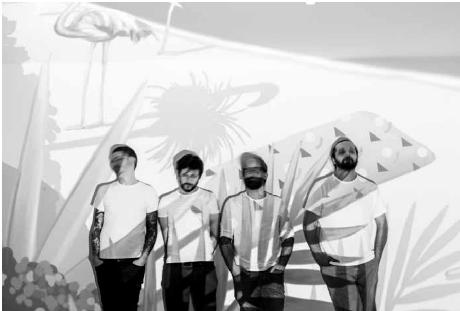
Haben eigentlich noch nie Metal gemacht: No Metal in This Battle.