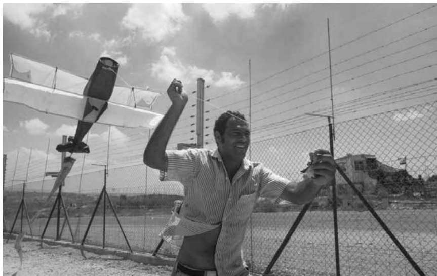
Une exposition qui va sûrement encore une fois provoquer des avis tranchés : « Photography as protest in Palestine/Israël » - du 12 au 18 novembre au Hariko à Bonnevoie.

« 'Nested' est la récolte de plusieurs années de travaux variés qui ont pour point commun le rapport des hommes à la nature, avec l'utilisation de minéraux et de végétaux dans des œuvres toujours aussi étonnantes. » (Christophe Chohin)