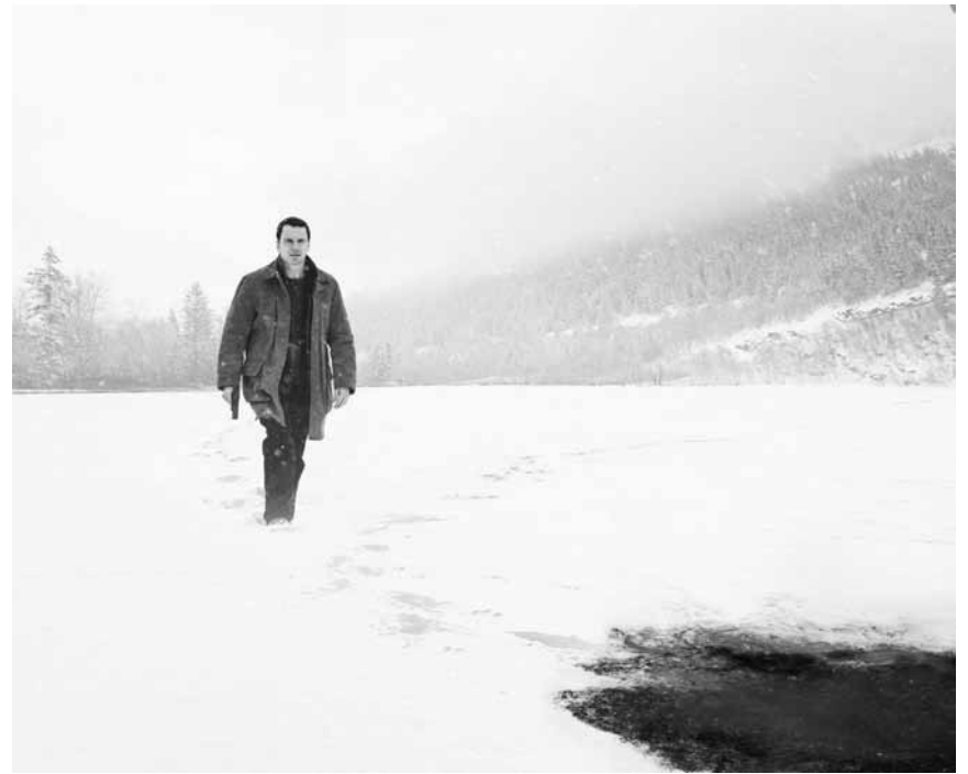
Eiskalter Thriller direkt aus der Hölle: „The Snowman“ - neu in (fast) allen Sälen.

Bigfoot Junior Cars 3: Evolution Fack ju Göthe 3 Geostorm Justice League Nelyubov Richard de Storch The Emoji Movie The Snowman