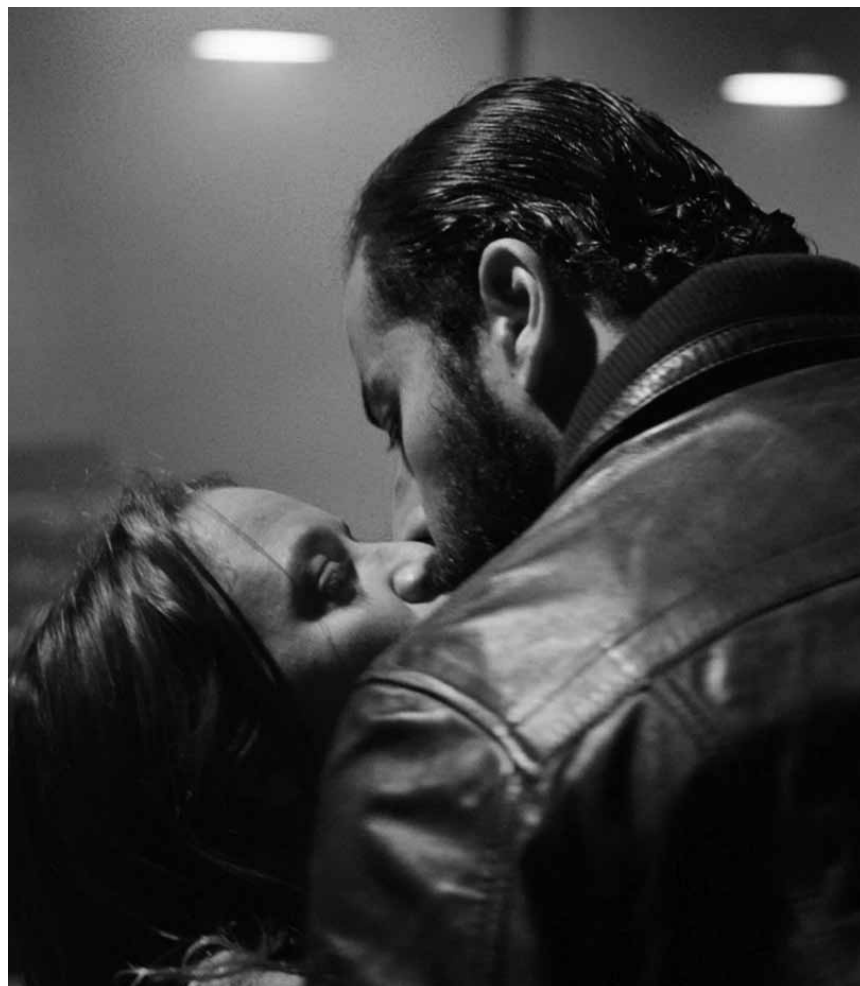
Avec « M », projeté à l'Utopia dans le cadre du cycle Out of the Box, l'actrice Sara Forestier signe un premier long métrage personnel et engagé sur la différence et l'analphabétisme.

1973 befindet sich die Profi-Tennispielerin Billie Jean King als Weltranglistenerste auf dem vorläufigen Höhepunkt ihrer Karriere. Doch die vielen Turniersiege und der Ruhm sind nicht alles für sie, denn King setzt sich außerdem mit Vehemenz für die Gleichberechtigung von Frauen ein. Bobby Riggs hingegen hat seine besten Jahre schon lange hinter sich. Um den Ruhm alter Tage wieder aufleben lassen ist er jedoch bereit, seine ganze Reputation aufs Spiel zu setzen. In der Öffentlichkeit vertritt er bezüglich der Geschlechterdebatte die entgegengesetzte Meinung zu der von King und so kommt es zum unvermeidlichen Zusammenprall in einem Tennismatch der Geschlechter, das als „Battle Of The Sexes“ in die Geschichte eingehen soll.