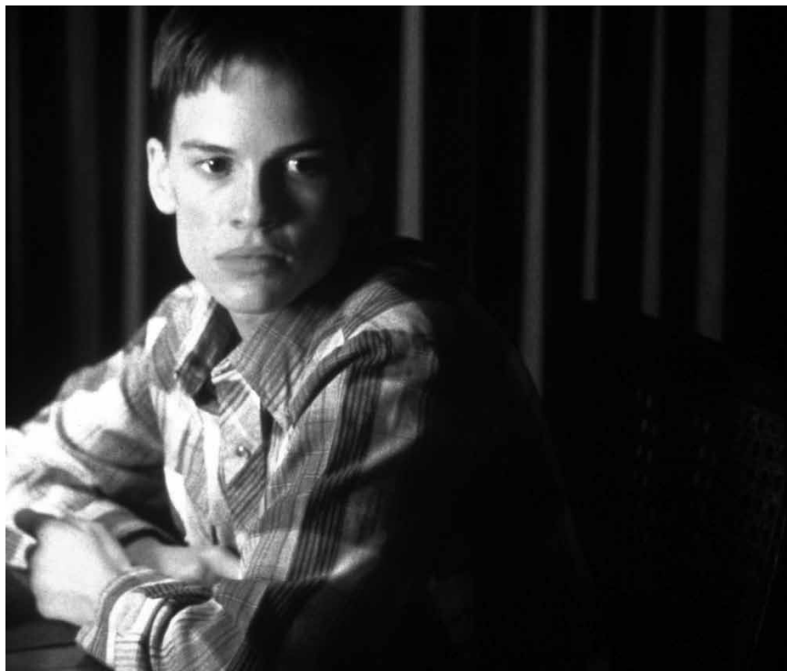
Die Rolle, die Hillary Swank auf die großen Leinwände brachte: „Boys Don't Cry“, wohl das erste Transgender-Drama der rezenten Filmgeschichte - am 25. November in der Cinémathèque.

Im Schweden der 1930er Jahre wird das 14-jährige Sami-Mädchen Elle Marja im Zuge eines Kultivierungsprogramms, das den nördlichsten Volksgruppen die schwedische Sprache und Kultur näherbringen soll, in ein Internat geschickt. Viele Kilometer von ihrer Heimat entfernt beginnt sich Elle Marja, die zuvor mit ihren Eltern und ihrer kleinen Schwester von der Rentierzucht lebte, für ihre Sami-Identität zu schämen und ihre Herkunft zu verleugnen.