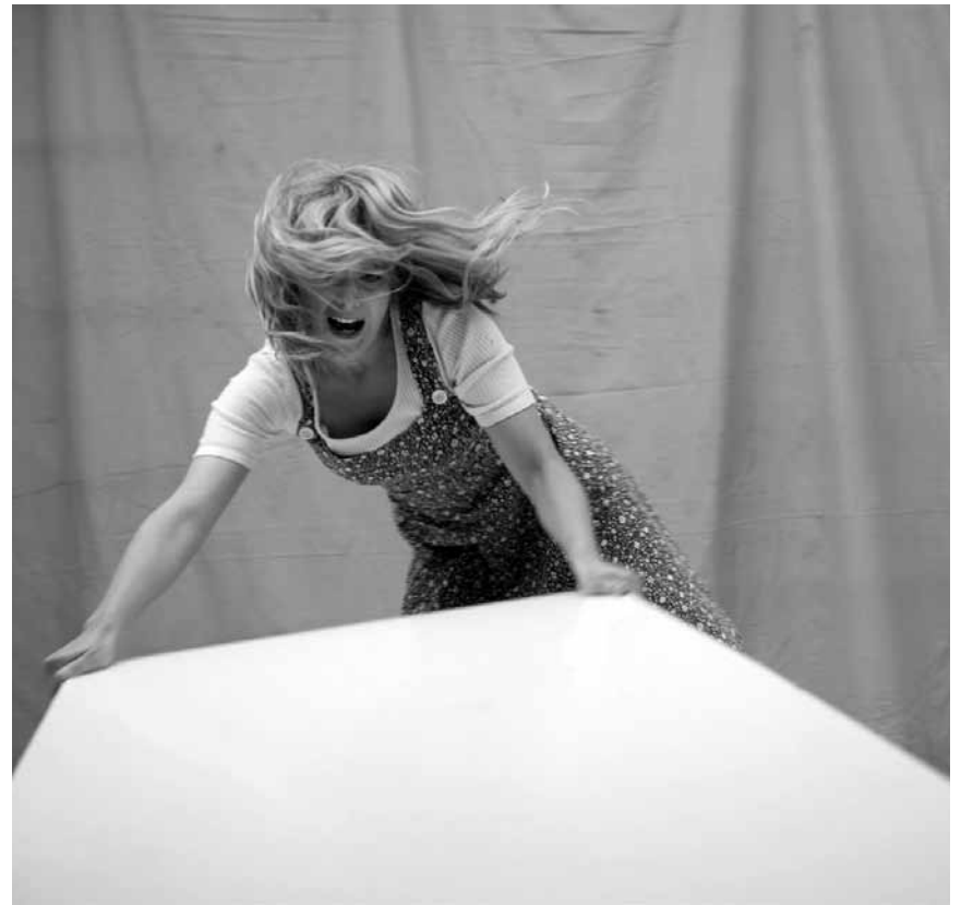
Le combat d'une jeune actrice provinciale contre le chauvinisme culturel parigot et le chauvinisme tout court : « Maryline » - nouveau à l'Utopia.

Seit einem Jahr ist der berühmte Maler Vincent van Gogh tot, da erhält der junge Armand Roulin von seinem Vater, dem Postmeister Joseph Roulin, unverhofft den Auftrag, einen Brief van Goghs an dessen Bruder Theo zu überreichen. Zunächst nimmt