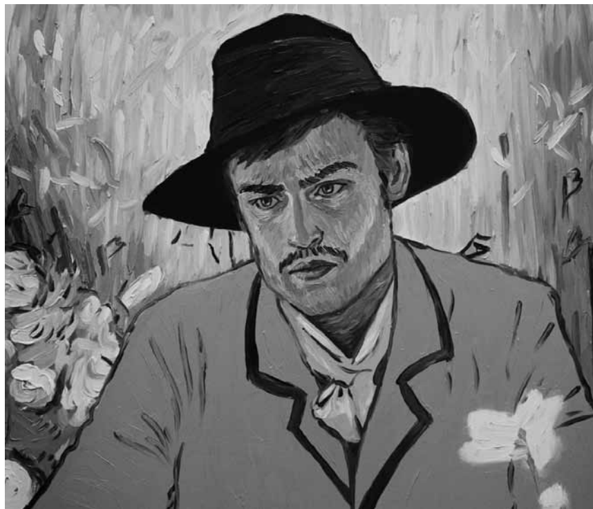
Ein ganzer Film als Ölgemälde ... besser hätte man Van Gogh nicht huldigen können - „Loving Vincent“, neu im Utopia.

Im Norden Calais wohnt die gutbürgerliche Familie Laurent in ihrer eigenen Wohlstandsblase und eigenen Problemen. Familienoberhaupt George hat gerade einen Selbstmordversuch hinter sich und sitzt im Rollstuhl. Seine Tochter Anne ist mit Lawrence Bradshaw verlobt und leitet das familieneigene Bauunternehmen. Ihr Sohn Pierre sieht sich hingegen noch nicht als zukünftiger Chef. Georges Sohn Thomas hingegen ist Arzt und frischgebackener Vater mit seiner zweiten Frau Anaïs, aber untreu, was