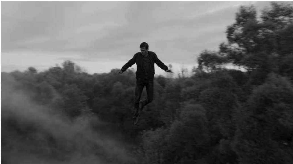
S'élever au-dessus des brumes des frontières : la lévitation, une des allégories du film.