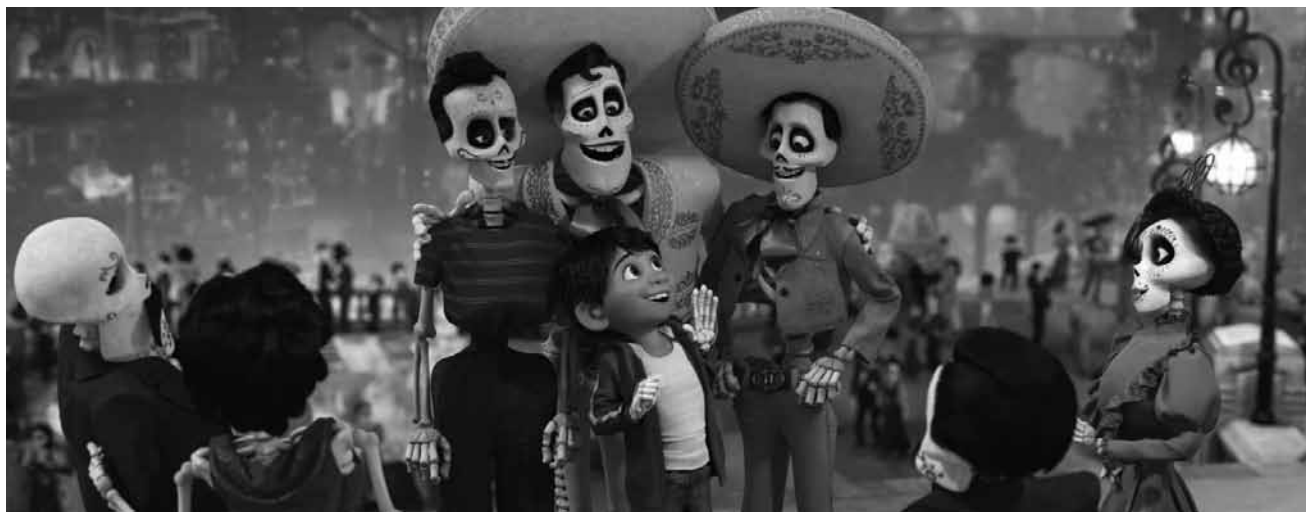
Dass der Tod auch mal knallbunt und quietschlebig sein kann beweist „Coco“, neu in fast allen Sälen.

beendet. Doch vom Ruhestand will der rote Rennwagen nichts wissen, vielmehr steckt er sich ein neues ehrgeiziges Ziel. Er will das Rennen „Florida 500“ gewinnen und den Jungspunden zeigen, dass er immer noch das Zeug zum Sieger hat. Doch vor allem der blitzschnelle Newcomer Jackson Storm ist für Lightning McQueen ein ernstzunehmender Gegner und mit etlichen technischen Spielereien ausgestattet, über die McQueen nicht verfügt. Und so holt er sich Hilfe von der jungen Renntechnikerin Cruz Ramirez: Sie soll ihn trainieren und ihm die neuesten Tricks aus dem Rennzirkus beibringen.