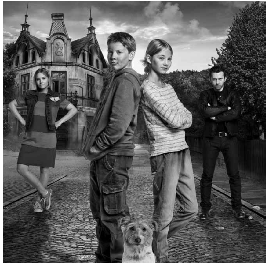
In einem polnischem Internat geht es hoch her: „Tarapaty“ - Extra am Sonntag, dem 10. Dezember im Kinopolis Kirchberg.