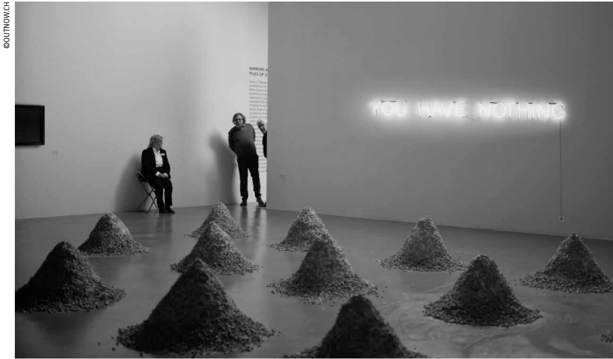
Manche Museumsgäste in „The Square“ wissen mit diesem Kunstwerk nicht viel anzufangen.