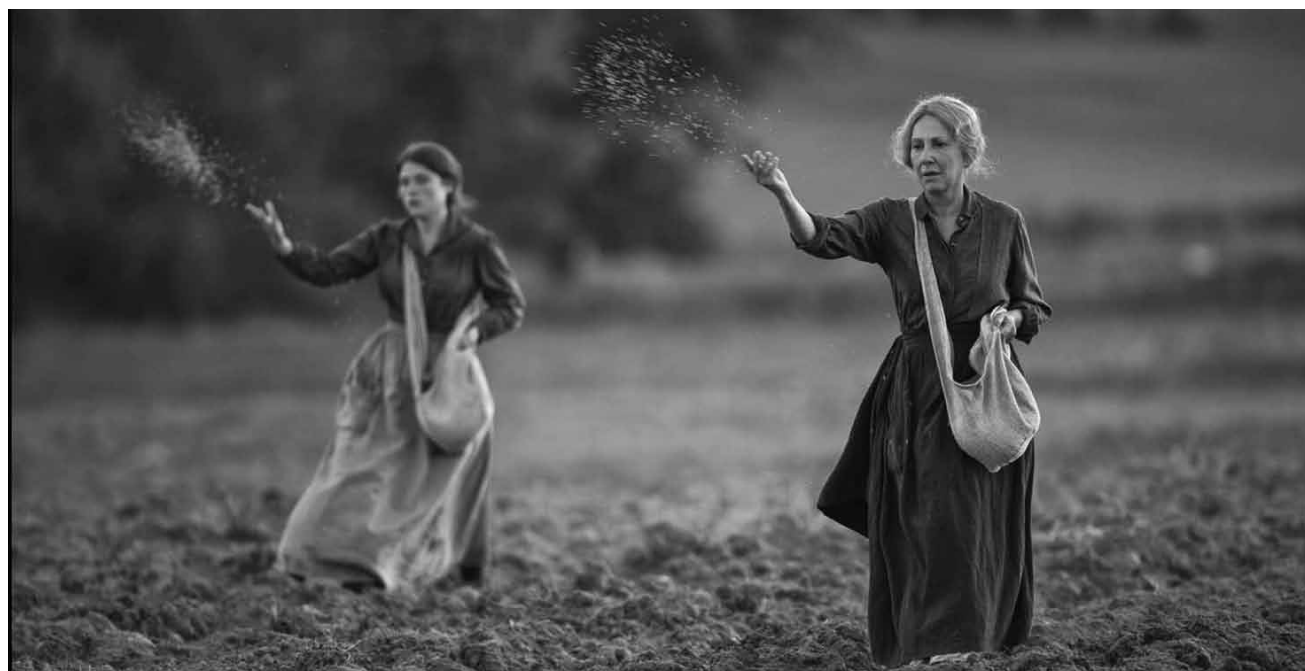
La Grande Guerre autrement : dans « Les gardiennes », Xavier Beauvois raconte le sort des femmes restées à la campagne pendant que leurs hommes se faisaient massacrer dans les tranchées - nouveau à l'Utopia.

1844, kurz vor der industriellen Revolution, lebt der erst 26-jährige Karl Marx mit seiner Frau Jenny im französischen Exil in Paris. Eines Tages wird ihm der junge Friedrich Engels vorgestellt, doch für den feinen Bourgeois und Sohn eines Fabrikbesitzers hat der andauernd bankrotte Familienvater Marx zunächst nur Verachtung übrig. Bald aber zeigt sich, dass die beiden mehr als nur denselben Humor gemeinsam haben. ☞ Schwache Schauspielleistungen, schlechte Dialoge, vernachlässigte weibliche Figuren, holpriger Schnitt - es gibt viele Gründe, einen großen Bogen um den Film „Der junge Karl Marx“ des haitianischen Regisseurs Raoul Peck zu machen. Schade! (tj)