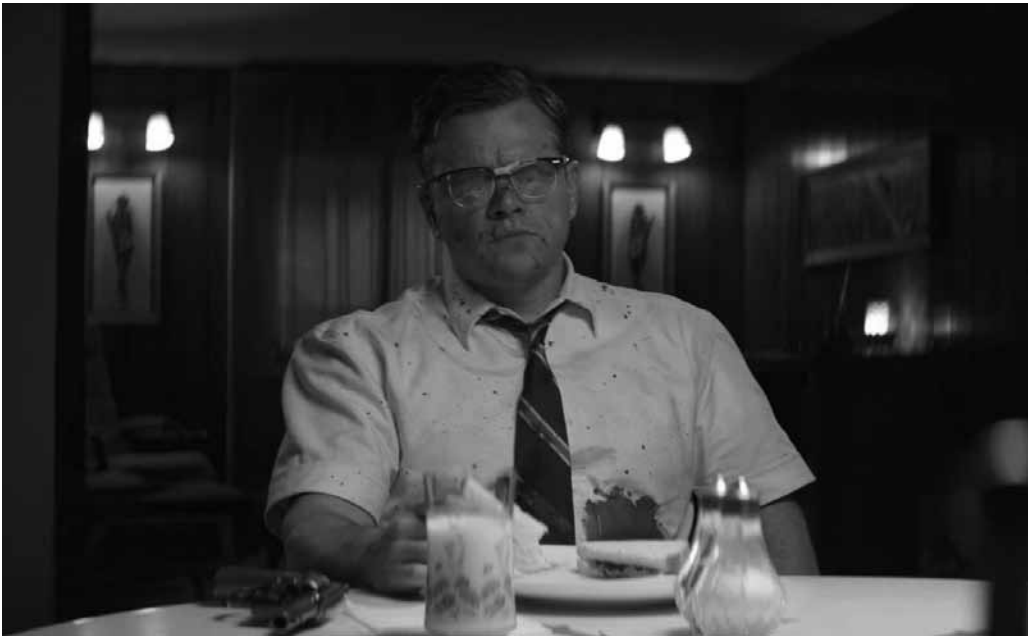
Il en prend plein la gueule : Matt Damon dans « Suburbicon ».