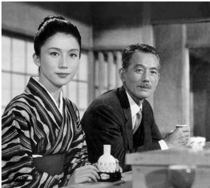
Décidément, quand une ronde de saké de trop se termine avec un mariage père-fille, on se trouve dans un classique japonais : « Samma no aji »(Le goût du saké) de Yasujiro Ozu - lundi 18 décembre à la Cinémathèque.