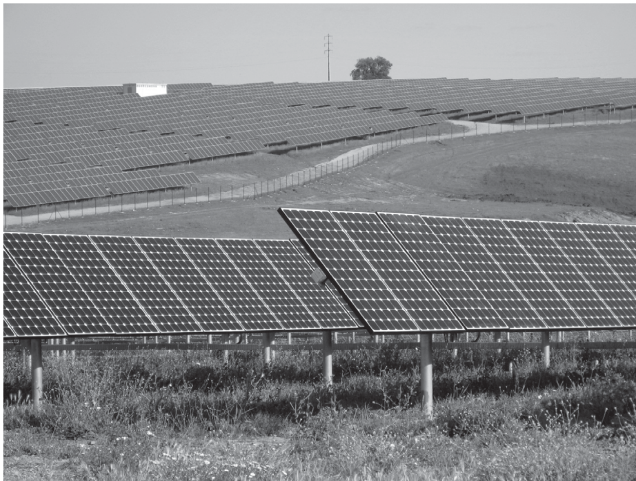
Fotovoltaik-Freiflächenanlagen in Portugal.