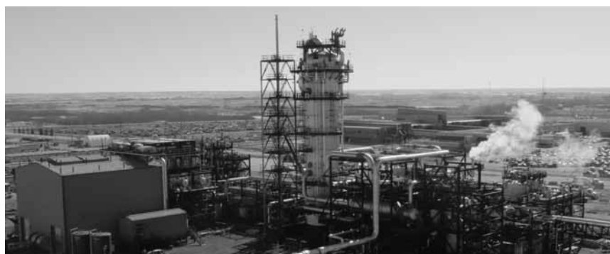
Eine Carbon Capture and Storage-Anlage in Kanada.