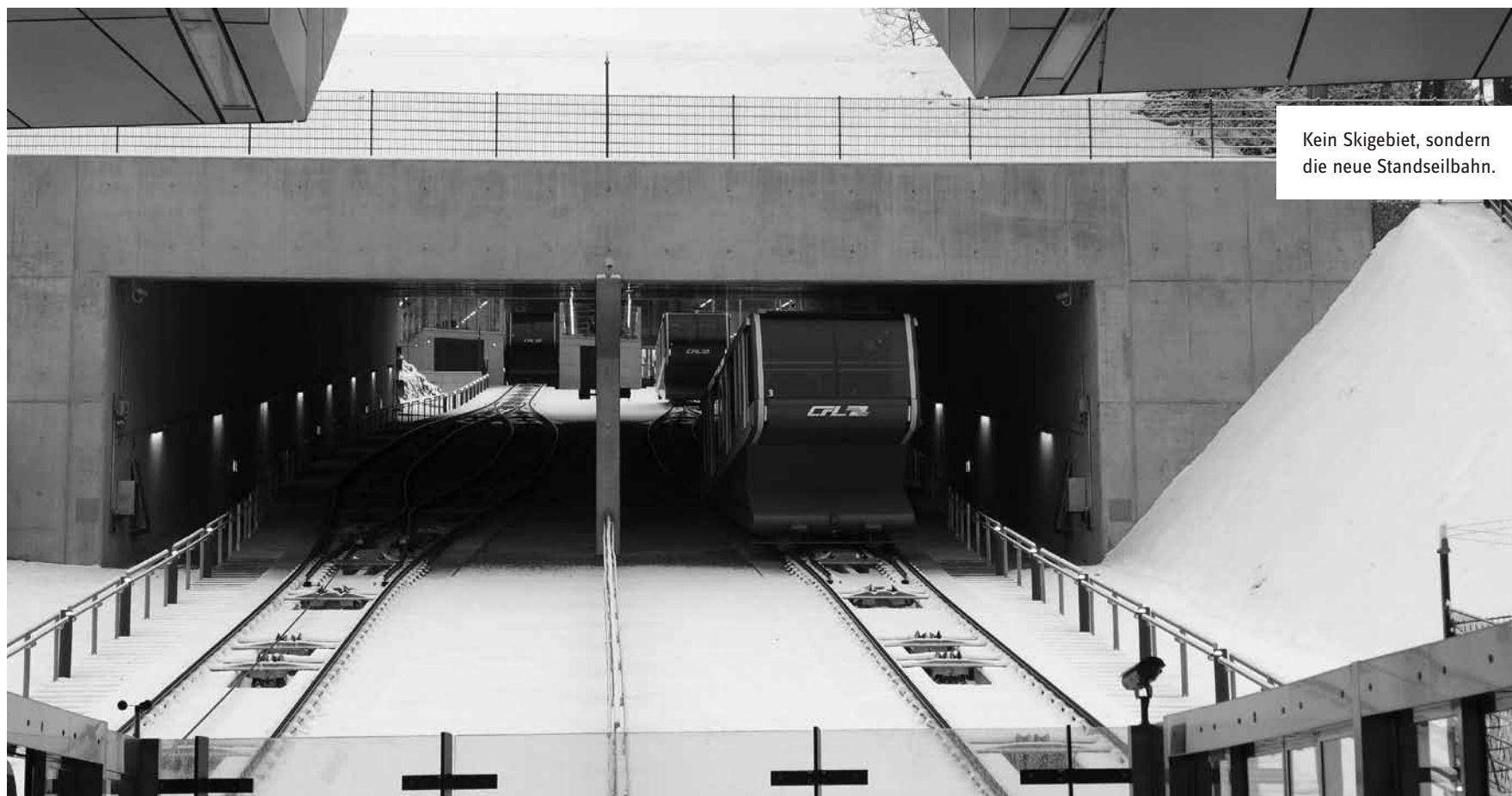
Kein Skigebiet, sondern die neue Standseilbahn.

soll wieder angenehmer werden, auf der A3 zu fahren. Was im Gegenzug heißt, dass dies dann auch wieder mehr Menschen tun werden. Um der alten verkehrsplanerischen Weisheit „Wer Straßen baut, wird Verkehr ernten“ etwas entgegenzusetzen, brachte François Bausch die Idee ins Gespräch, die dritte Spur für Busse und Fahrgemeinschaften zu reservieren. Das Konzept der „High occupancy vehicle lane“ (HOVL) ist nicht neu, hat aber einige Tücken. Nicht nur, dass im Gesetz zum A3-Ausbau jeder Hinweis auf eine HOVL fehlt, es wären auch spezielle bauliche Maßnahmen nötig, um eine solche Spur effizient zu führen. Ein schlecht ausgeführter Pilotversuch könnte dazu führen, dass das Konzept schnell wieder aufgegeben wird. So wie es in den Niederlanden geschah, als 1993 in der Nähe von Amsterdam die erste europäische HOVL eröffnet wurde. Da kaum ein Auto drei Insassen aufwies, wurde die Spur auch kaum genutzt – bis ein Gericht entschied, dass die Einschränkung ohne ein Gesetz, das Fahrgemeinschaften definiert, nicht zulässig sei. Wie die politische Landschaft bei der Eröffnung der dritten Spur aussehen wird, ist sowieso noch ungewiss – und wie schnell sich die Verkehrspolitik ändern kann, zeigt das Beispiel Luxemburg-Stadt.