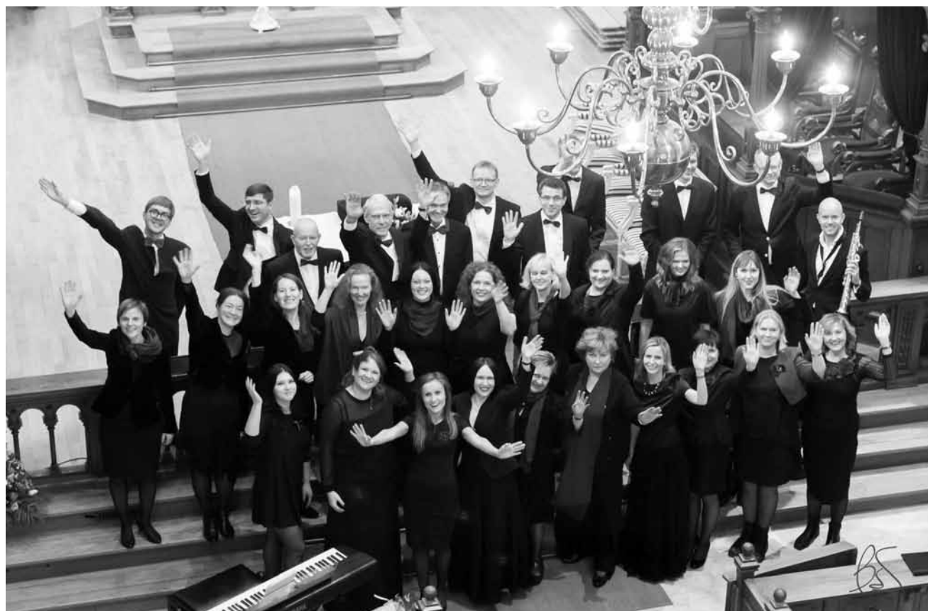
Difficile d'organiser une soirée plus Noël que celle-ci : ce samedi 16 décembre, la Chorale lettone « Meluzina » de Luxembourg donnera un concert à l'église protestante de la capitale.

Nico'ZZ Band , blues, Café Little Woodstock, Ernzen , 21h30. Tél. 26 87 38 21. www.thelittlewoodstock.com