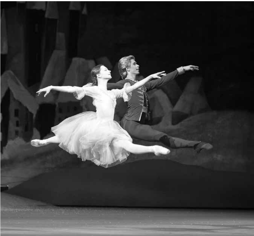
Give in to the magic of Christmas with this classic: "The Nutcracker" – at the Utopia, captured live from the Bolshoi Theatre in Moscow.

Augsburger Puppenkiste: Als der Weihnachtsmann vom Himmel fiel D 2017 von Martin Stefaniak und Julian Köberer. 64'. O.-Ton. Für alle.