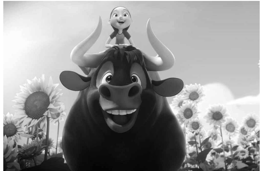
Ein eigentlich netter Stier muss in die Kampfarena. Ob seine Freunde ihn aus dieser Nummer rausholen können? „Ferdinand“ - neu im Kinepolis Belval und Kirchberg.

USA 2017 von Sean Anders. Mit Will Ferrell, Mark Wahlberg und Mel Gibson. 98'. Ab 12.