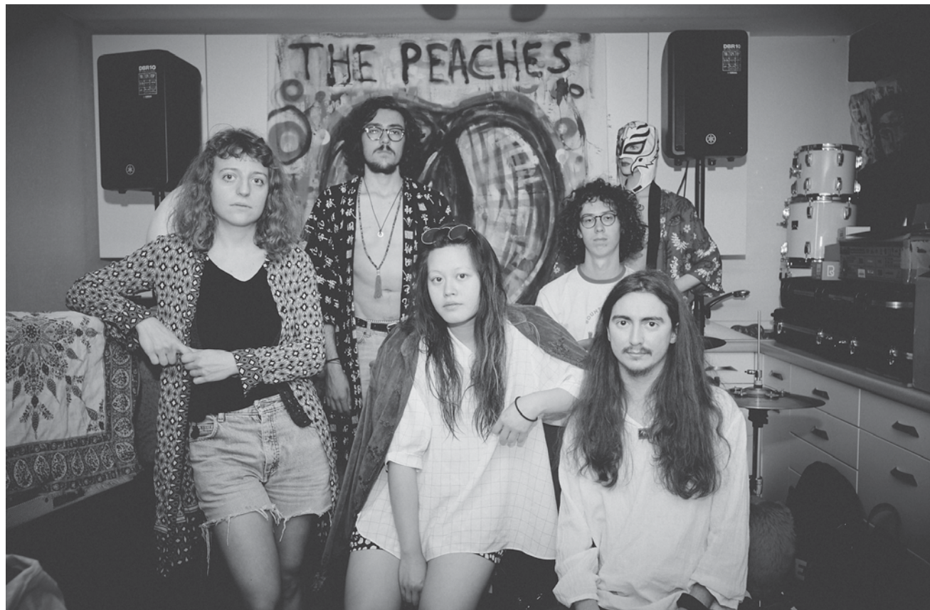
Das Home Saint-Hubert in Péttingen lädt am 16. Dezember zum 9. Newcomer Band Contest „Rock the South“ mit unter anderen den psychedelischen Fruchtliebhabern „The Chippy Bumpy Peaches“.

Die Dreigroschenoper , Schauspiel von Bertolt Brecht, Theater Trier, Trier (D), 19h30. Tél. 0049 651 7 18 18 18. www.theatertrier.de