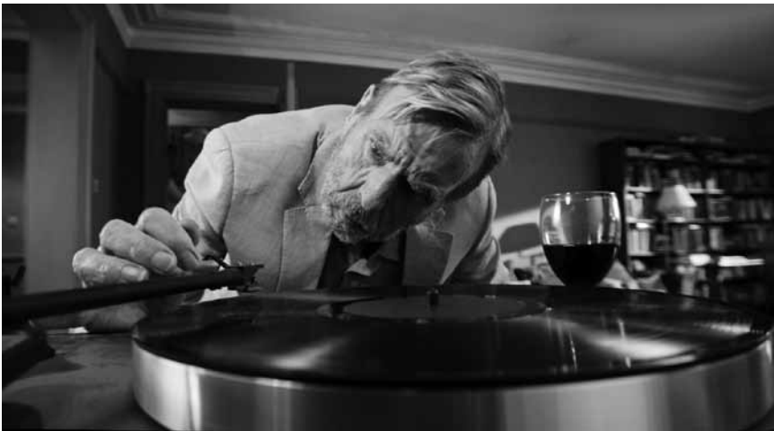
Feinster britischer Humor um Ehrgeiz, Verrat und Freundschaft: „The Party“ von und mit Sally Potter – neu im Utopia.

schon wächst in ihm der Verdacht, dass ein Serienkiller wieder aus dem Ruhestand zurückgekehrt ist, der nie geschnappt wurde. Der „Schneemann“ genannte Mörder hat Harry persönlich auserkoren und fordert ihn mit spöttischen Nachrichten und absichtlich platzierten Hinweisen zu einem intellektuellen Wettstreit heraus.