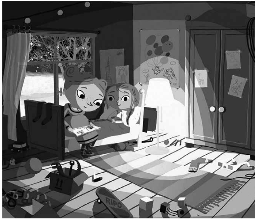
Une petite fille, une souris et... un biscuit vont vivre des fêtes pas comme les autres dans « Myrtille et la lettre au père Noël » - nouveau aux Kinepolis Belval et Kirchberg.

Neïla Salah a grandi à Créteil et rêve de devenir avocate. Inscrite à la grande université parisienne d'Assas, elle se confronte dès le premier jour à Pierre Mazard, professeur connu pour ses provocations et ses dérapages. Pour se racheter une conduite, ce dernier accepte de préparer Neïla au prestigieux concours d'éloquence. À la fois cynique et exigeant, Pierre pourrait devenir le mentor dont elle a besoin. Encore faut-il qu'ils parviennent tous les deux à dépasser leurs préjugés.