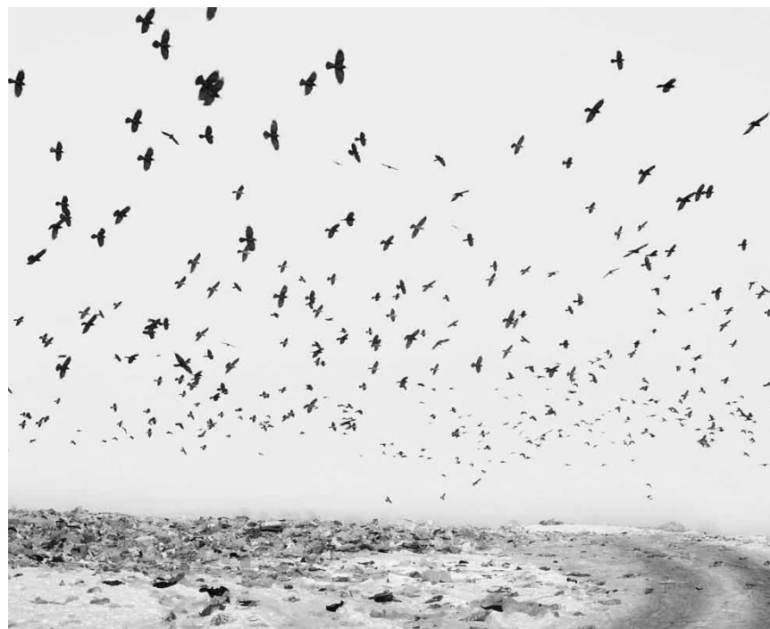
Toujours pas de fin à l'horizon pour l'expo « Notes for an Epilogue » de Tamas Deszo - à voir encore jusqu'au 30 mars au Schlassgaart à Clervaux.