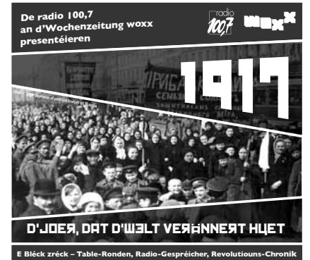
E Blick zrëck – Table-Ronden, Radio-Gespräicher, Revolutions-Chronik