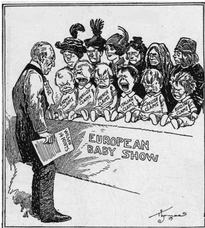
Wilson und die plärrenden Kinder: Karikatur zu den territorialen Forderungen in Europa am Ende des Krieges.

geben? [...] Doch weshalb länger bei euch „Annexionisten“ verweilen? Ihr seid eine Handvoll sog. Intellektueller, ein Fähnlein-Führer, die keinen Anhang im Volke haben, es mag eurer Ideologie und eurem Stolze passen, Bürger eines großen Staatswesens zu werden: Aber das Volk? Was hat das Volk davon, wenn es von Paris oder Brüssel aus regiert wird?“