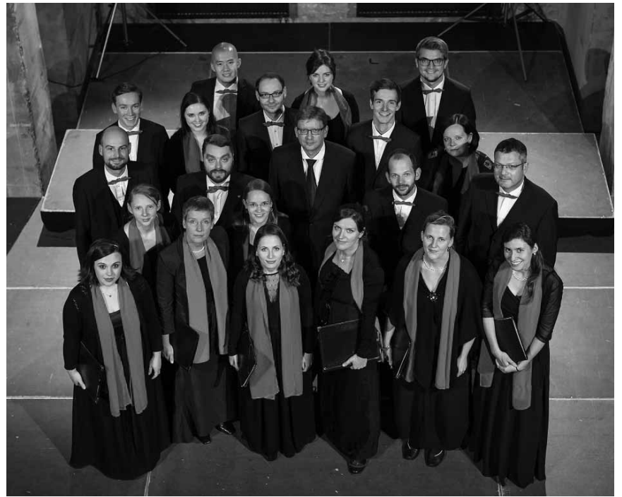
Une rencontre franco-allemande en chœur : le Dresdner Kammerchor avec le chœur du conservatoire de Metz-Métropole et Le Concert lorrain interpréteront le « Weihnachtsoratorium » de Bach, le 22 décembre à l'Arsenal de Metz.