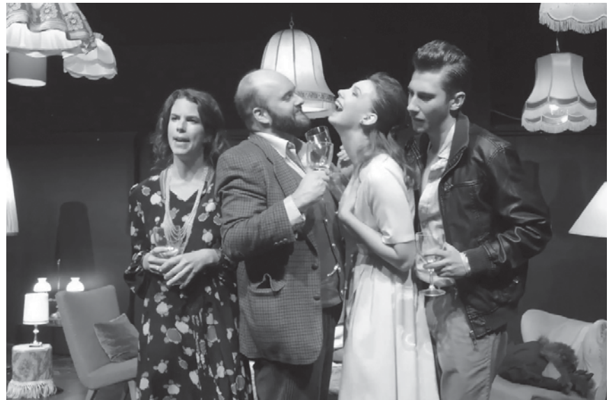
Da ist's nicht immer schön: „Hinter der Fassade“ - Schauspiel von Florian Zeller - am 23. und am 27. Dezember und am 6. Januar im Theater Trier.

Evita , Musical by Tim Rice and Andrew Lloyd Webber, Grand Théâtre, Luxembourg , 15h. Tel. 47 08 95-1. www.lestheatres.lu