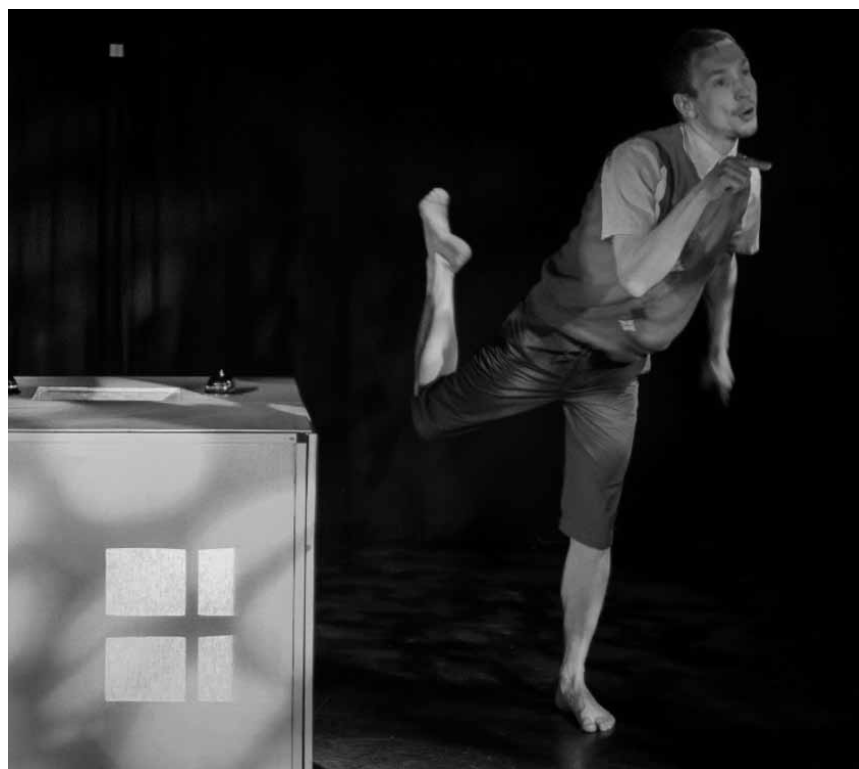
Ein Theaterstück für die ganz Kleinen: In „Kluizelaar“ dreht sich alles um ein ganz kleines Haus - am 29. und 30. Dezember in den Rotondes.

Rock Quiz , Rock Solid, Luxembourg , 20h30.