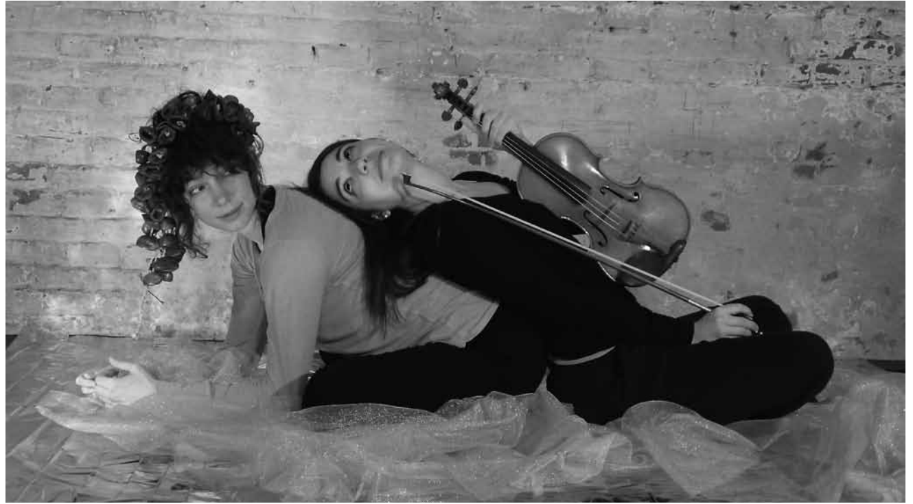
Und wenn die Kleinen nicht genug vom Theater kriegen können: Am 30. Dezember wird „Goldmädchen“ im Grand Théâtre aufgeführt.