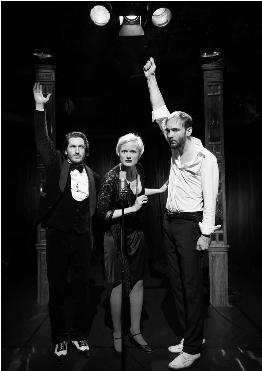
A-cappella-Gesang vom Feinsten gibt es am 7. Januar im Cube521 in Marnach mit „Mutti's Kinder“.

Stadhaus, Differdange , 11h + 15h30. Tel. 58 77 1-19 00. www.stadhaus.lu Aschreiwung erwünscht.