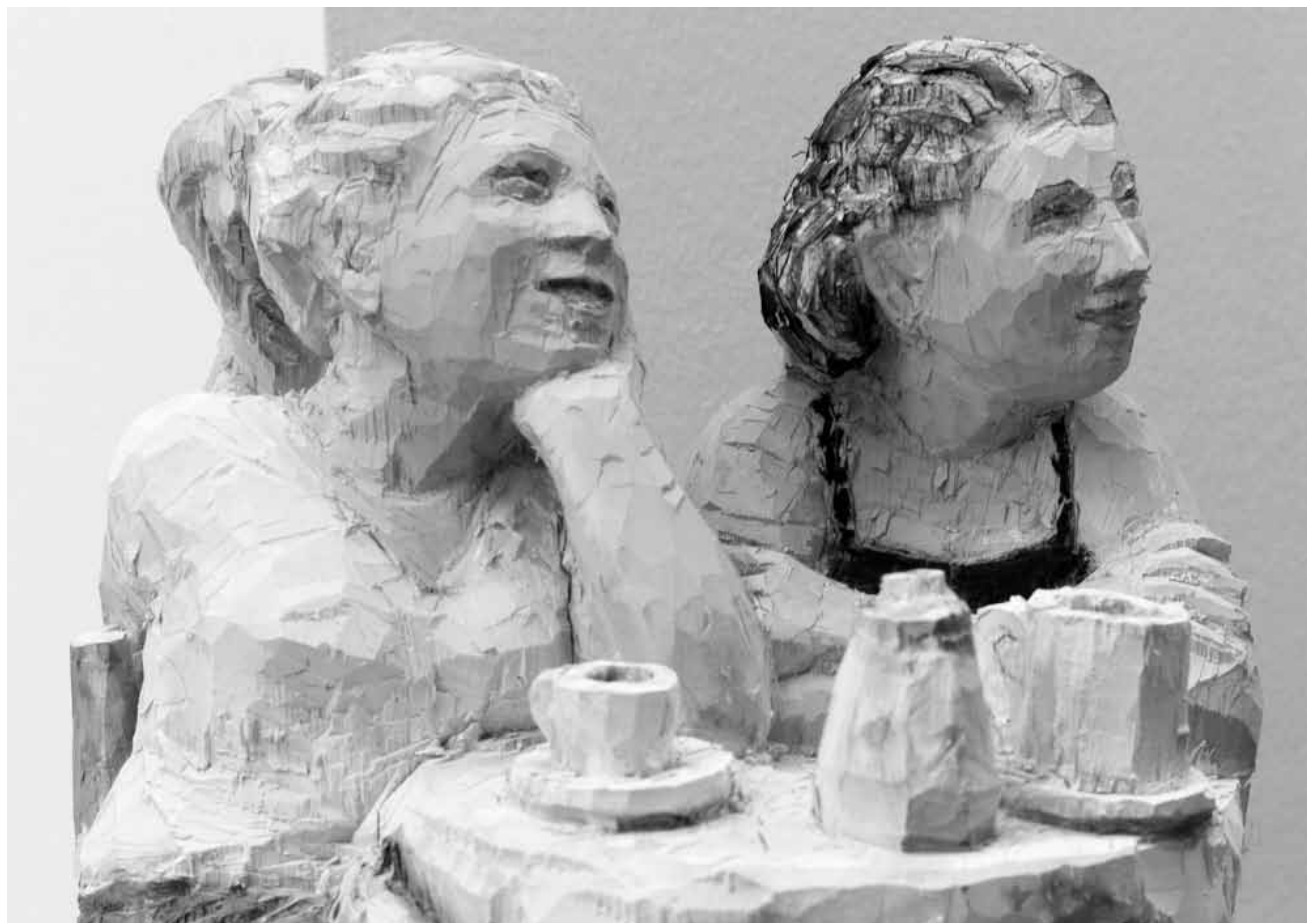
Zeigen aus welchem Holz sie geschnitzt sind: Die Skulpturen von Raimund Gröbner sind (zusammen mit den Malereien von Mirna Sišul) vom 13. Januar bis zum 7. Februar in der Galerie Schortgen zu sehen.

Lëtzebuerg City Museum (14, rue du Saint-Esprit. Tél. 47 96 45 00), jusqu'au 31.3.2019,