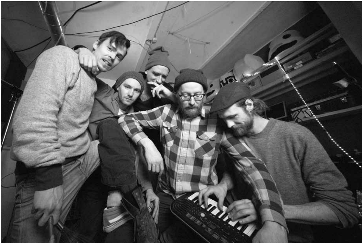
Peng! Da kommen schon die Tentakel!