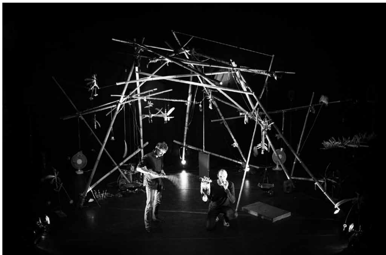
Des « Poids-Plumes » pour les tout-petits : la compagnie Ouïe/Dire présentera son spectacle les 13 et 14 janvier aux Rotondes.

Atelier parents-enfants sur tablettes tactiles , (> 5 ans), Casino Luxembourg - Forum d'art contemporain, Luxembourg, 15h30. Tél. 22 50 45. www.casino-luxembourg.lu Inscription obligatoire.