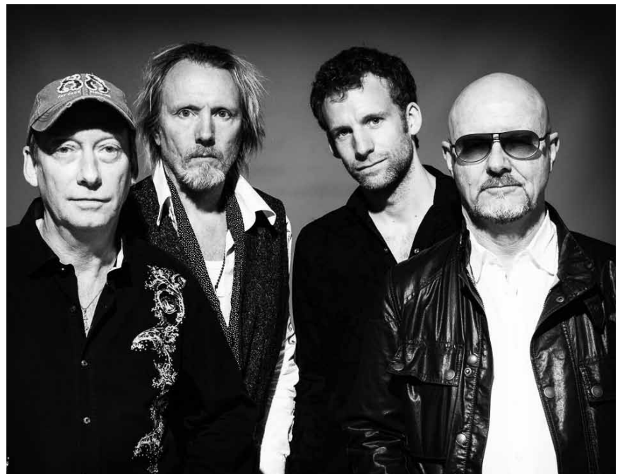
Speckigen Classic Rock satt gibt es am 12. Januar im Duksaal in Freudenburg mit Wishbone Ash.