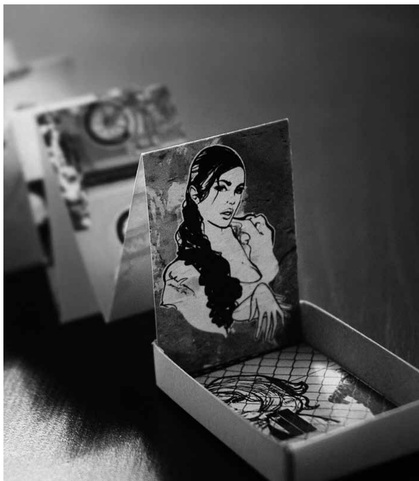
La « 5e Biennale du livre d'artiste » proposera de belles découvertes au public - à l'espace Beau Site d'Arlon jusqu'au 11 février.