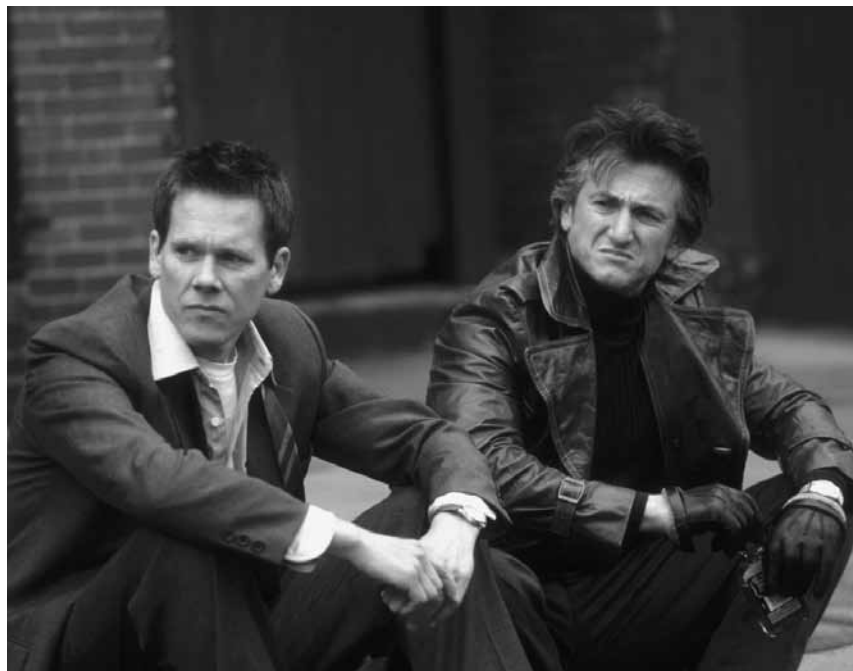
Eine Geschichte über Freundschaft, Traumata und Vergangenheitsbewältigung: „Mystic River“ - am Sonntag, dem 28. Januar in der Cinémathèque.

Gus, Harry und Archie, drei Männer im besten Alter, leben mit ihren Gattinnen in New Yorker Vororten. Der Tod eines gemeinsamen Freundes bringt die Männer wieder näher zusammen und sie gönnen sich einen richtigen Männerausflug. Als sie jedoch schließlich in London landen, müssen sich die drei mit ihrer eigenen Sterblichkeit auseinandersetzen und entscheiden, wie sie den Rest ihres Lebens verbringen wollen.