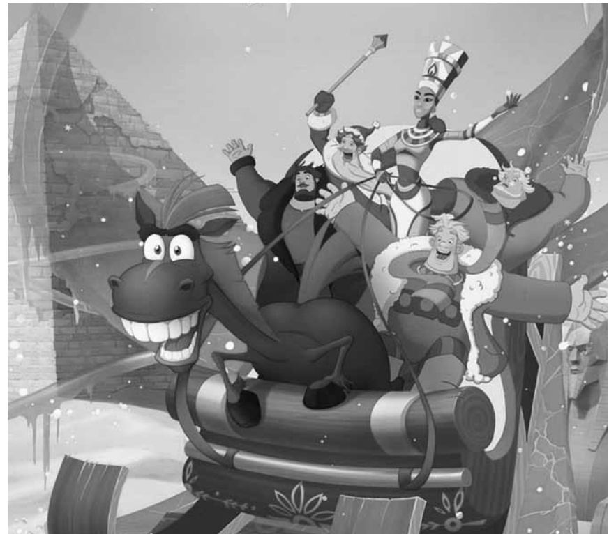
Mal was Anderes, der russische Animationsfilm: „Tri bogatyrya i printsessa Egipta (Drei Helden und die ägyptische Prinzessin)“ - läuft am 21. Januar im Kinopolis Kirchberg.