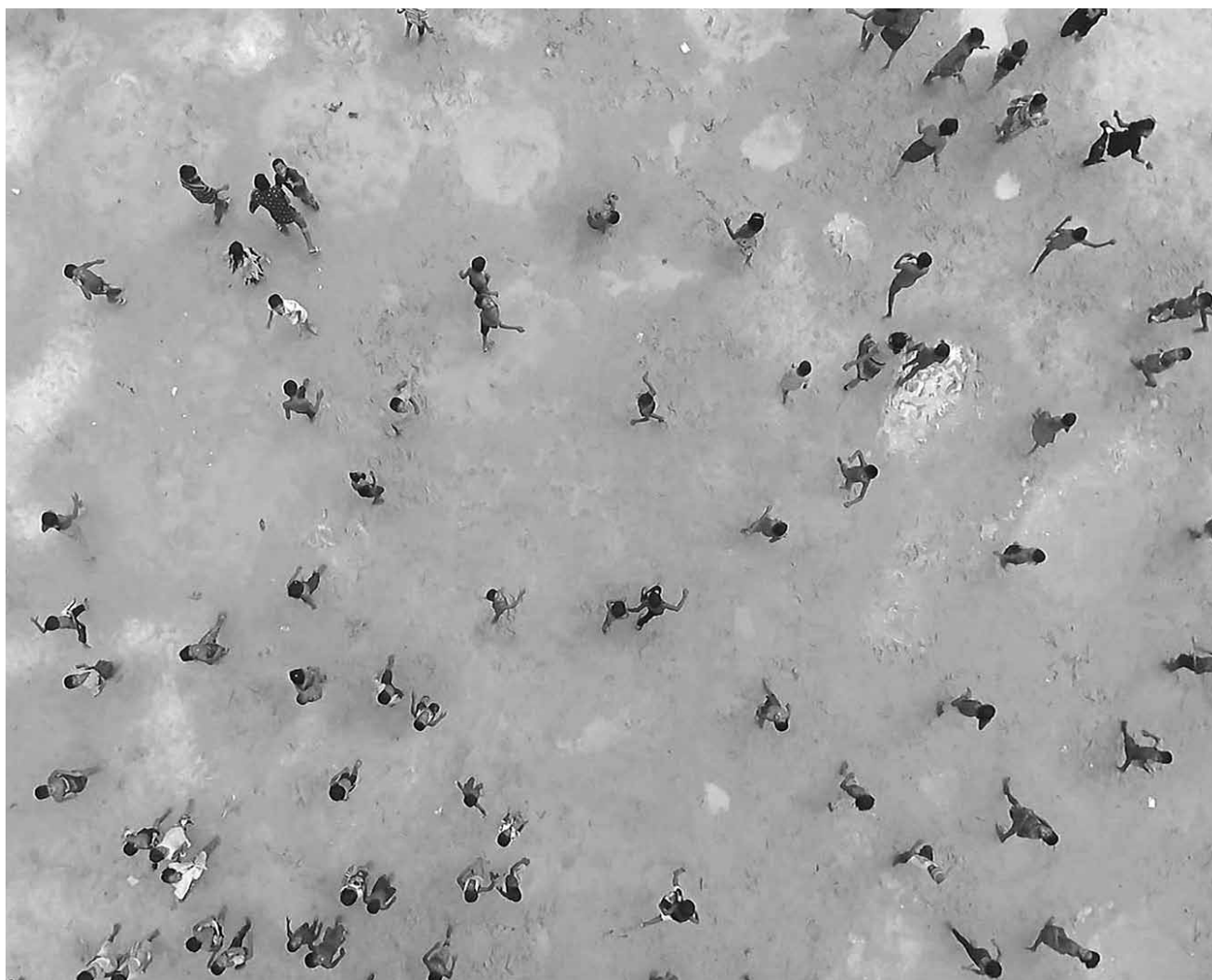
Ai Weiwei ist zwar sicher nicht der erste Künstler, der sich mit der Flüchtlingskrise befasst, aber seine Stimme wird „Human Flow“ sicher einiges an Gewicht verleihen – neu im Utopia.

Mann, der zu den reichsten der Welt gehört, ein Lösegeld zu erpressen. Gail Harris, die Mutter des Entführten, versucht, Getty mithilfe von Fletcher Chase zur Zahlung zu bewegen, doch als er sich weigert, laufen die Ereignisse aus dem Ruder.