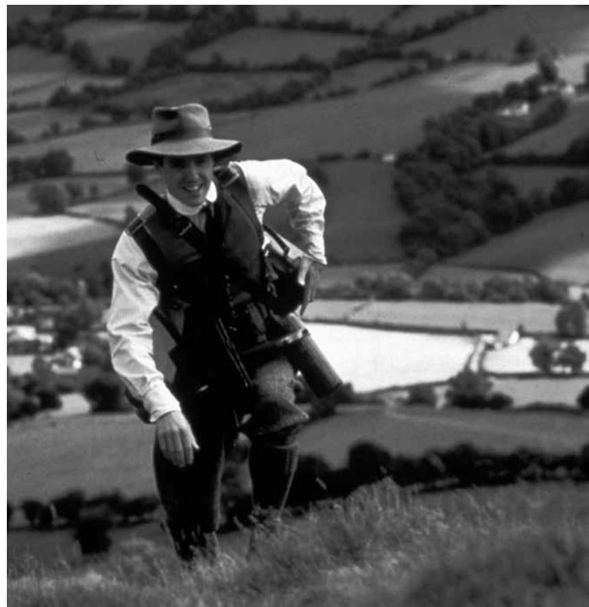
Um Vermessung und Vermessenheit geht es in „The Englishman Who Went up a Hill but Came down a Mountain“ - an diesem Samstag, dem 27. Januar in der Cinémathèque.

Mabel Longhetti hat sich darauf eingerichtet, mit ihrem Mann Nick ein Wochenende allein zu haben, aber dann muss Nick, Vorarbeiter eines städtischen Bautrupps, absagen: ein Wasserbruch hält ihn und seine Leute über Nacht draußen fest. Aus Frust zieht Mabel durch die Kneipen und landet schließlich mit einem fremden Mann im Bett. Geplagt von Schuldgefühlen versucht sie nun, Nick die perfekte Hausfrau vorzuspielen.