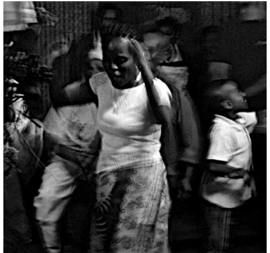
Von der sonnigen Île de la Réunion ins nasskalte Saarbrücken: Trans Kabar treten an diesem Freitag, dem 2. Februar im Haus Garellly auf.