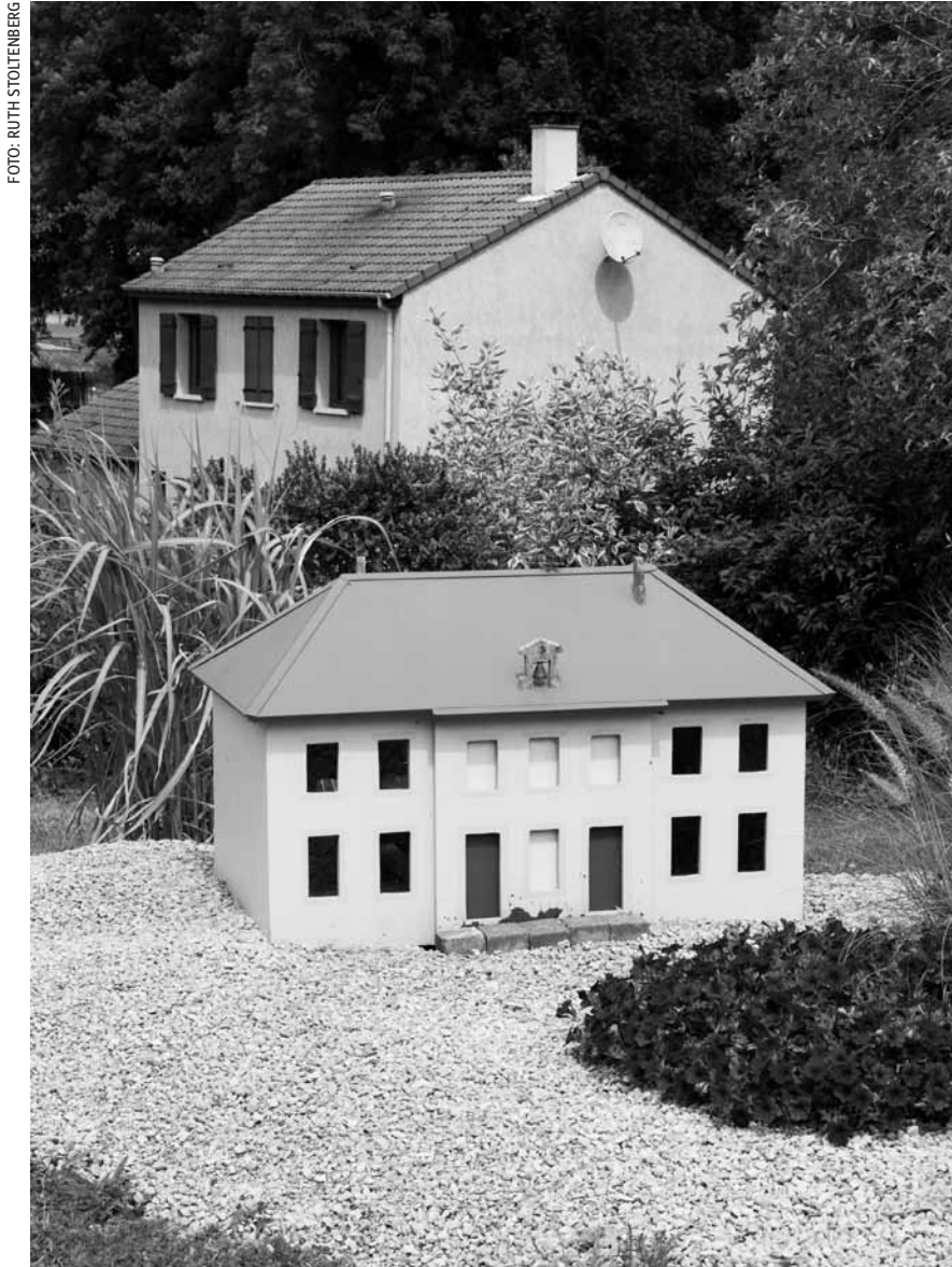
Kleines Haus, ganz groß – die Fotos von Ruth Stoltenberg, Esther Hagenmaier und Sylvie Felgueiras sind im Rahmen des „Opus Fotopreis 2017“ in der Kapelle der Abtei Neumünster zu sehen – noch bis zum 21. Februar.