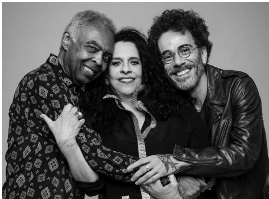
Une combinaison gagnante pour les fans de musique brésilienne : Gilberto Gil, Nando Reis et Gal Costa vont ensorceler la Philharmonie le 18 mars. Dernières places à la caisse du soir !

La maladie de la mort , d'après le roman de Marguerite Duras, mise en scène de Katie Mitchell, avec