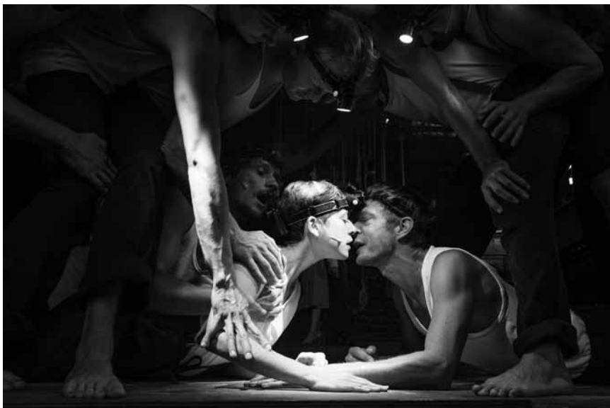
Das Thalia Theater aus Hamburg schaut mal wieder im Großen Theater vorbei. Diesmal unter anderen mit einem Zola-Marathon: „Liebe, Geld & Hunger“ – an diesem Sonntag, dem 11. März.

Stanislaw Lem, Alte Feuerwache, Saarbrücken (D), 18h. Tel. 0049 681 30 92-486. www.staatstheater.saarland