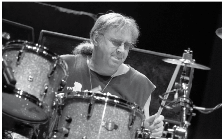
Ian Paice, le cofondateur (et seul membre permanent) des légendaires Deep Purple fait une escale au Kursaal de Limbourg (B), ce samedi 10 mars.

Le « code Hays », la censure à l'hollywoodienne , ciné-conférence (L) avec Paul Lesch, Centre national de l'audiovisuel, Dudelange , 10h - 12h. Tél. 52 24 24-1. www.cna.public.lu