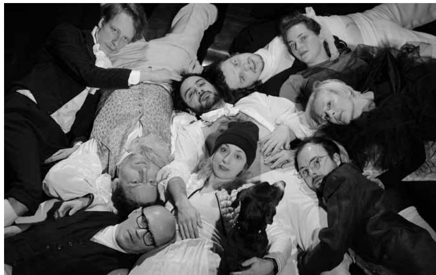
Der gute alte Georg Büchner wird wieder zum Leben erweckt mit seinem Stück „Dantons Tod“ – Premiere am 17. März im Saarländischen Staatstheater in Saarbrücken.

Den Ouschterhues a seng Gesellen , Bitzatelier (8-14 Joer), Kulturhaus Niederanven, Niederanven, 14h - 17h. Tél. 26 34 73-1. www.khn.lu Aschreiwung erwünscht.