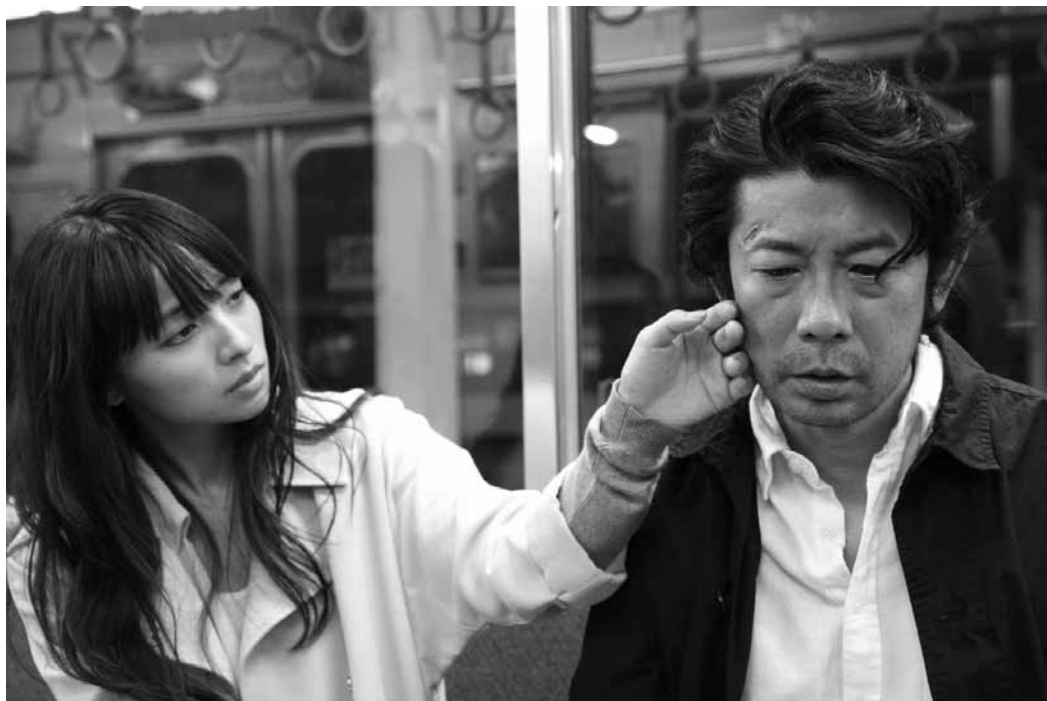
Un film qui célèbre la lumière... y compris celle, blafarde, d'un métro la nuit.