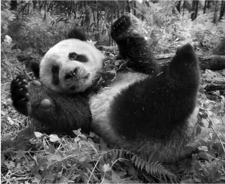
Alle Schönheiten der Natur an nur einem Tag erleben: „Earth: One Amazing Day“ – neu in fast allen Sälen.

que possède sa famille en Italie, à jouer de la musique classique, à lire et à flirter avec son amie Marzia. Un jour, Oliver, un séduisant Américain qui prépare son doctorat, vient travailler auprès du père d'Elio. Elio et Oliver vont bientôt découvrir l'éveil du désir, au cours d'un été ensoleillé dans la campagne italienne qui changera leur vie à jamais.