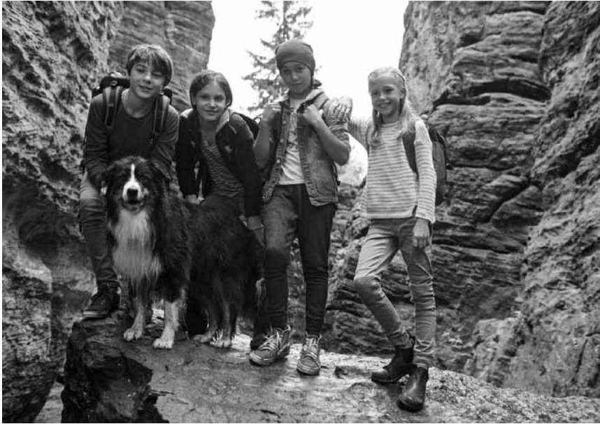
Urzeitgesen, Ferien und eine Verbrecherjagd – das alles wartet auf die Kleinen in „Fünf Freunde und das Tal der Dinosaurier“ – neu im Kinopolis Kirchberg und Belval, sowie im Scala.

prestigieux concours d'éloquence. À la fois cynique et exigeant, Pierre pourrait devenir le mentor dont elle a besoin. Encore faut-il qu'ils parviennent tous les deux à dépasser leurs préjugés.