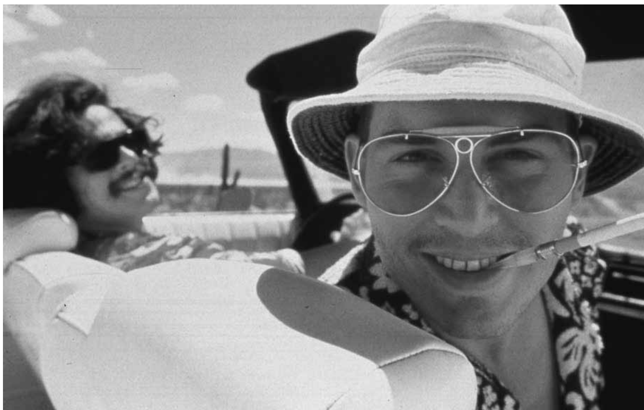
Die Mutter aller Drogenfilme: „Fear and Loathing in Las Vegas“ nach den Schriften des Hunter S. Thompson – am Montag, dem 19. März in der Cinémathèque.