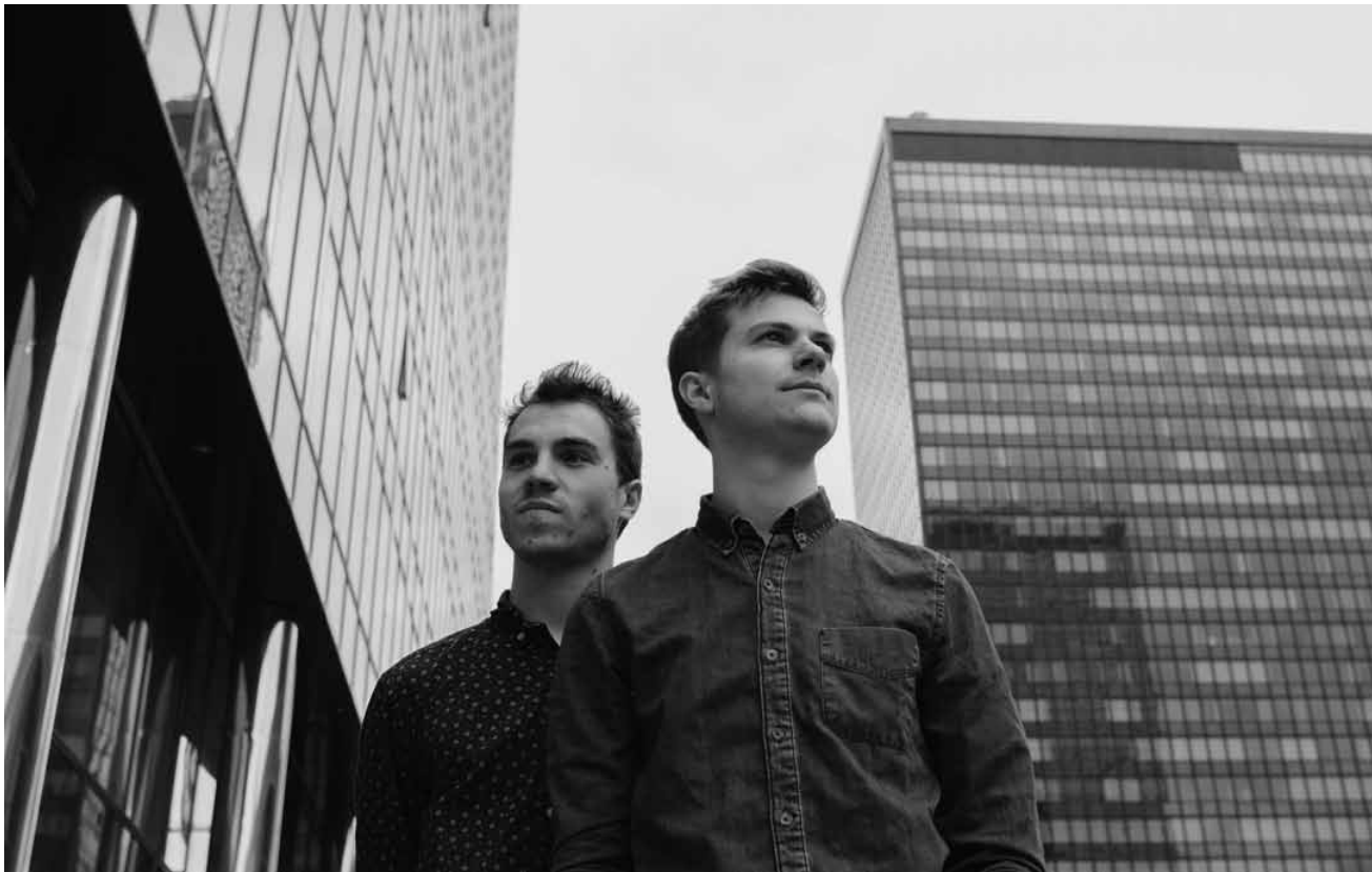
Originaires de Tournai et inspirés par ce qui se fait de plus contemporain dans le jazz, le duo Glass Museum jouera au Gudde Wëllen le 30 mars.