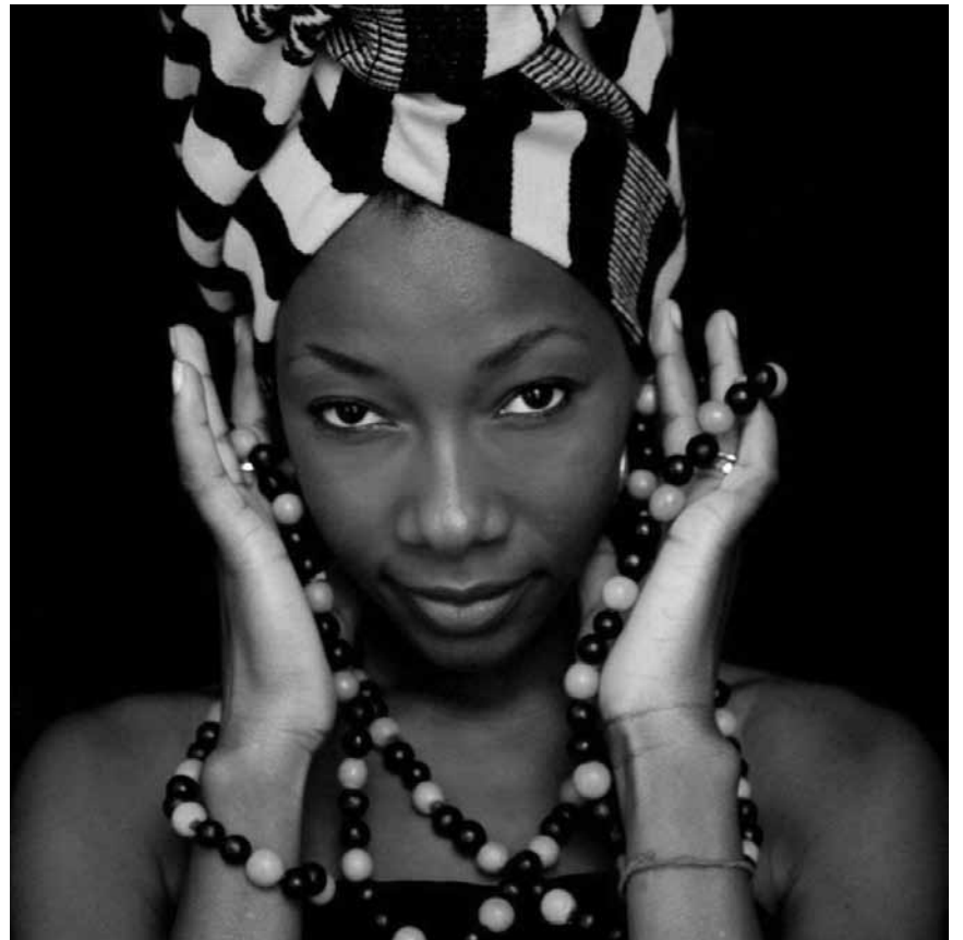
Pendant toute sa carrière, Fatoumata Diawara a cherché à faire le pont entre le jazz et les musiques traditionnelles maliennes - ce vendredi 23 mars, elle sera à la Philharmonie.