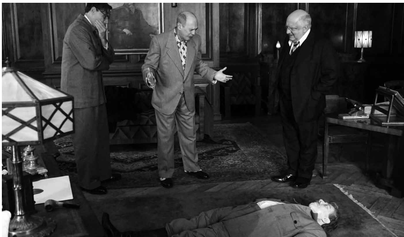
Un dictateur dans une flaque d'urine et des alliés «inconsolables».