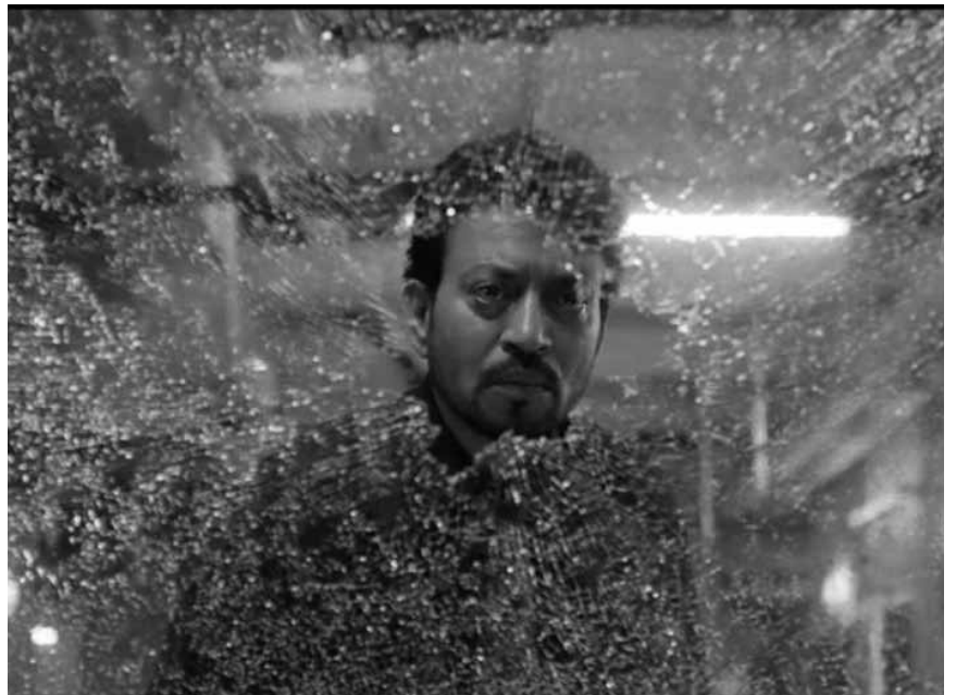
Better than physical violence anyway : In "Blackmail" an Indian man finds out that his wife is cheating on him, so he puts up an intrigue to punish her and her lover - new at Kinopolis Belval.

Wegen Wartungsarbeiten bleibt die Cinémathèque bis Mitte April geschlossen.