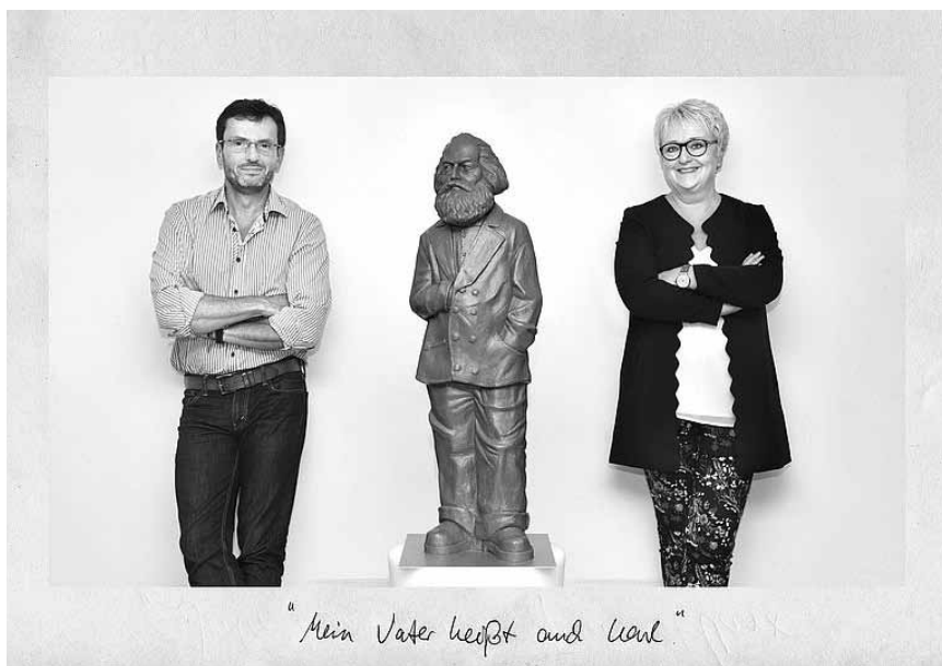
Solange sie die Mittel der Produktion da lassen wo sie sind... „Wir sind Marx“ - in der Trierer Fußgängerzone bis zum 21. April.

Führungen für Kinder an So. + Feiertagen 16h.