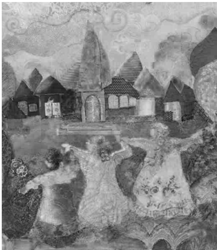
Und nicht das Wort: „Am Anfang war die Musik“ - die Bilder der ehemaligen Balletttänzerin Carla Rudbach sind vom 16. April bis zum 23. Mai im Trifolion in Echternach zu sehen.