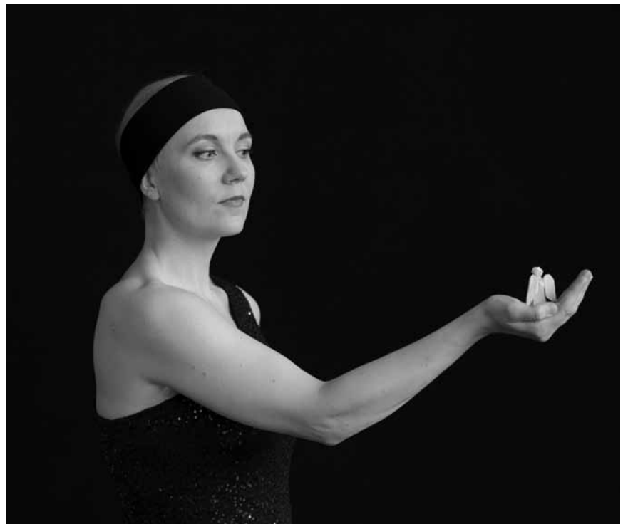
„Salomé“ - nach der Erzählung von Oscar Wilde in der Fassung von Richard Strauss, an diesem Samstag, dem 14. April im Saarländischen Staatstheater in Saarbrücken.