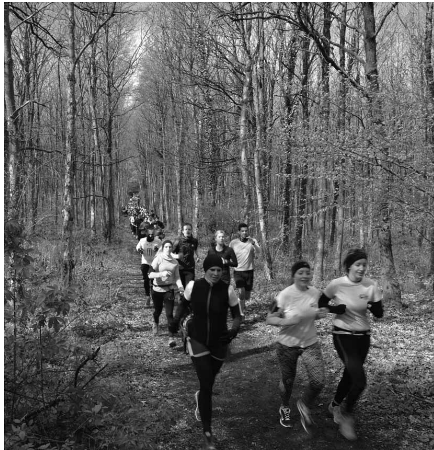
Wien nach net aus dem Wanterschlof erwächt ass, kann dat Sonnden, den 22. Abrëll beim „E Laf fir d'Natur“ nohuelen - den Départ ass op der Kockelschëier.