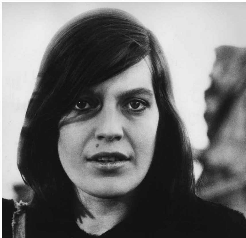
Mit Volker Schlöndorffs „Die verlorene Ehre der Katharina Blum“ ist es gleich doppelt wert sich am 23. April in der frisch entwanzen Cinémathèque einzufinden.

Auf einer Flugreise trifft der 50-jährige Unesco-Ingenieur Walter Faber auf den Bruder seines Studienfreundes Joachim Henke. Dieser hatte Fabers Jugendliebe Hannah geheiratet, doch bevor er ihn besuchen kann, begeht Joachim Selbstmord. Fabers Leben gerät ins Wanken. Auf einem Schiff nach Europa lernt er die 20-jährige Sabeth kennen. Fasziniert begleitet er die junge Frau und die beiden nähern sich an.