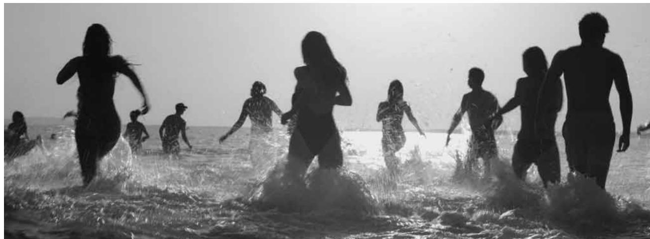
Plein de corps nus, de drague lourde et de scandales en vue... Abdellatif Kechiche nous ressert sa recette préférée dans « Mektoub, my love : canto uno » - nouveau à l'Utopia.

On pourrait reprocher à ce western, dont l'essentiel se passe sur des sentiers, un cheminement linéaire ou une vision esthétisante trop classique, mais l'émotion passe, tout simplement. (ft)