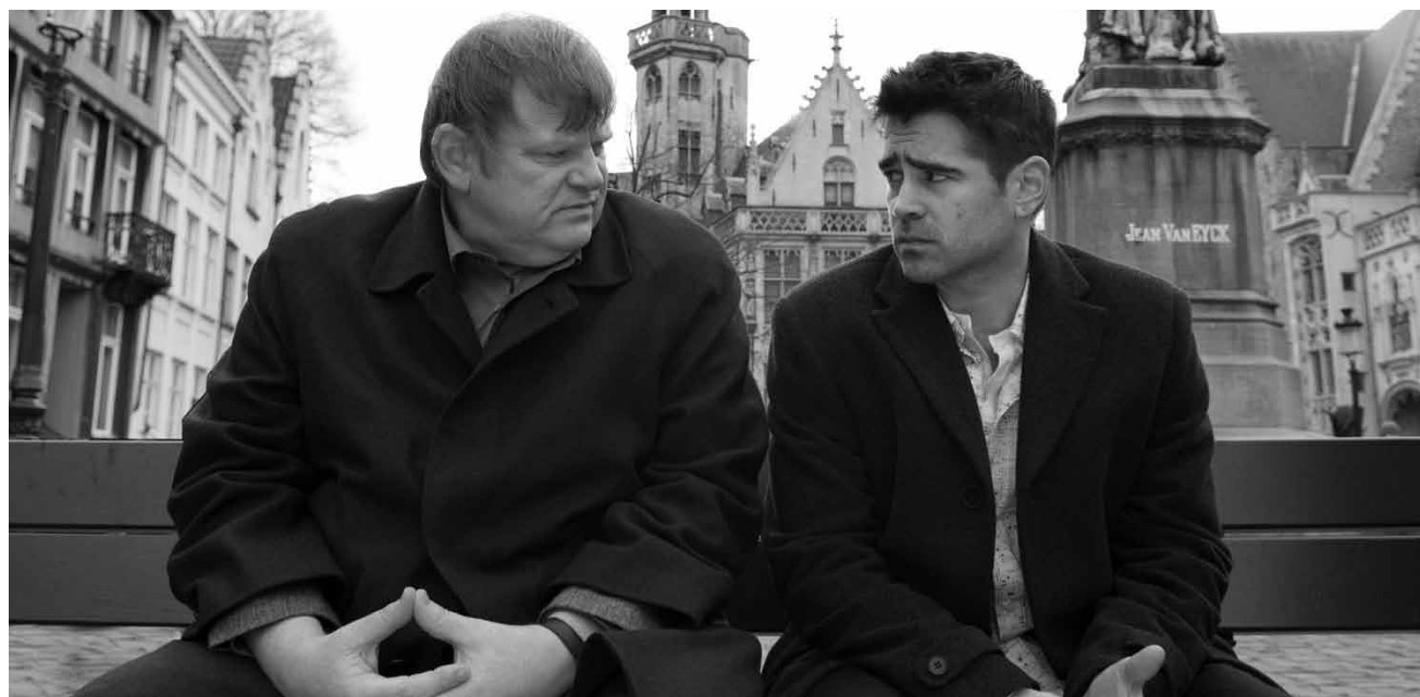
Brügge jenseits von Grachten, Schokolade und Bier: „In Bruges“ - am 27. April in der Cinémathèque.

Max Shrek will Gotham City schröpfen, um seine Gier nach Macht zu befriedigen. Als seine Sekretärin Selina Kyle seinen dunklen Machenschaften auf die Spur kommt, stößt er sie eiskalt in den Tod. Aber die verstörte Selina kommt wieder, mit einem großen Miau! Der Pinguin, der mit der Unterstützung von Max Shrek sein monströses Wesen vor den Bewohnern Gothams verbirgt, um als Bürgermeister Oswald Cobblepot gewählt zu werden, komplettiert die Riege der Schurken, denen Batman das Handwerk legen will.