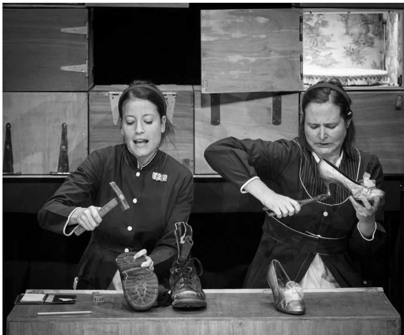
Chacun-e y prendra son pied : « Shoes », théâtre et objets pour les plus de trois ans, les 5 et 6 mai aux Rotondes.