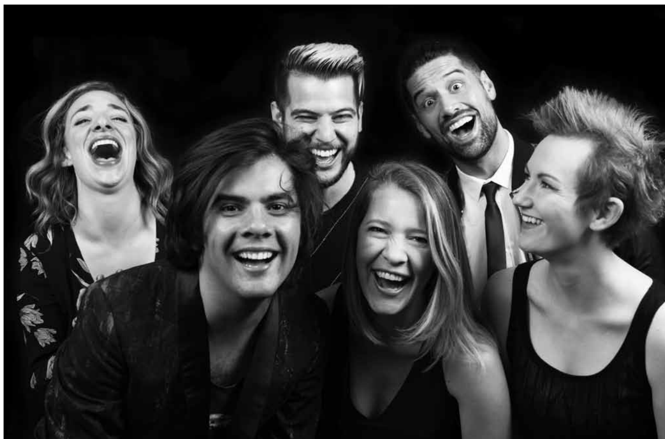
Keine Castingshow, sondern neu aufgelegte Opernklassiker werden „The Cast“ am 3. Mai in die Schungfabrik in Tetingen bringen.

Echt-Percussion Danzt , mat der Percussionsklass vun der lechternacher Museksschoul, Trifolion, Echternach, 19h. Tel. 26 72 39-1. www.trifolion.lu