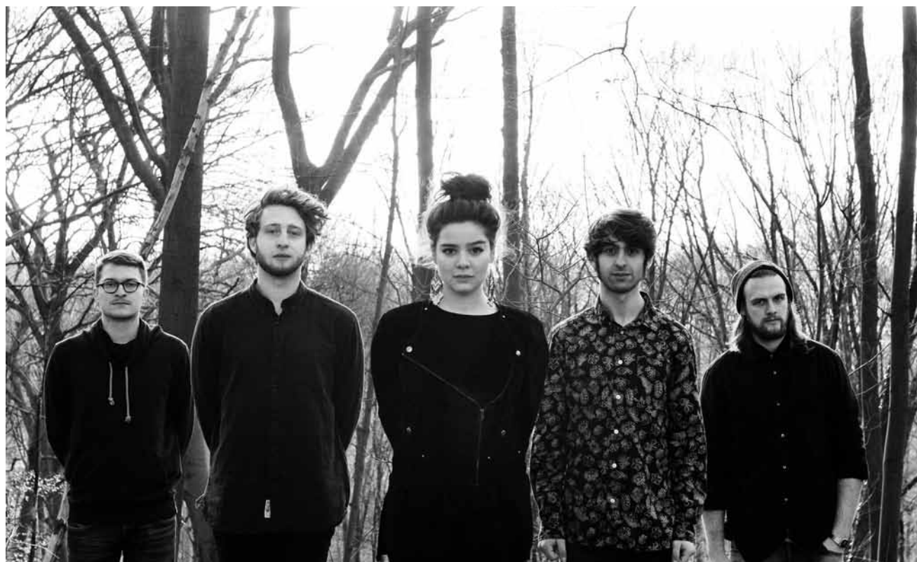
Die Kölner*innen von Moglebaum praktizieren Elektro-Pop mit Akustik-Elementen der netteren Sorte - an diesem Samstag, dem 28. April im Gudde Wëllen.