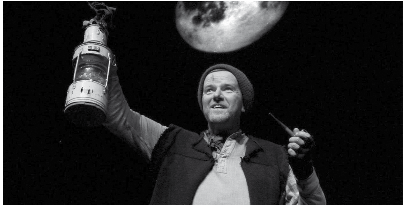
Wer bei den Namen Scott und Shackleton Gänsehaut kriegt ist bei „Tom Crean - Antarctic Explorer“ bestens aufgehoben - an diesem Freitag, dem 27. April im Altrimenti.

Watchdog, jazz, brasserie Terminus, Sarreguemines (F) , 21h. Tél. 0033 3 87 02 11 02. www.terminus-les.info