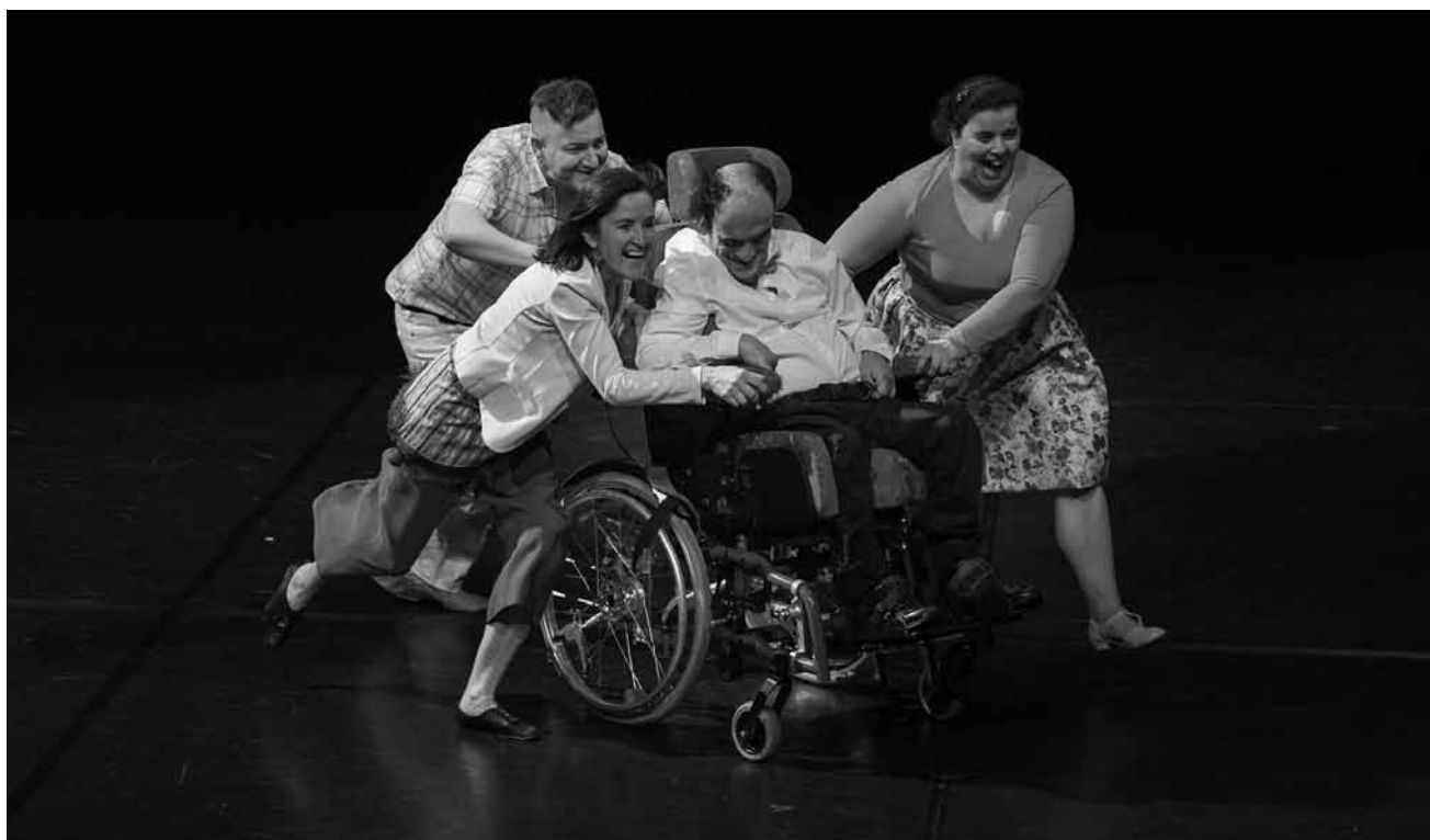
Suite du projet blanContact : « À part être » célèbre la vie sous toutes ses coutures au Grand Théâtre le 3 mai.

Inscription obligatoire jusqu'au 25.4 : makayser@vdl.lu ou tél. 47 96 42 15. Langue L. Dans le cadre des semaines de sensibilisation aux besoins spécifiques.