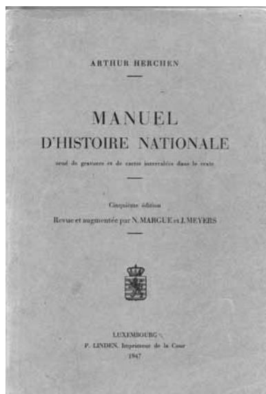
Viru Mee 68 an duerno: Geschichtsbicher fir de Secondaires-Unterricht.