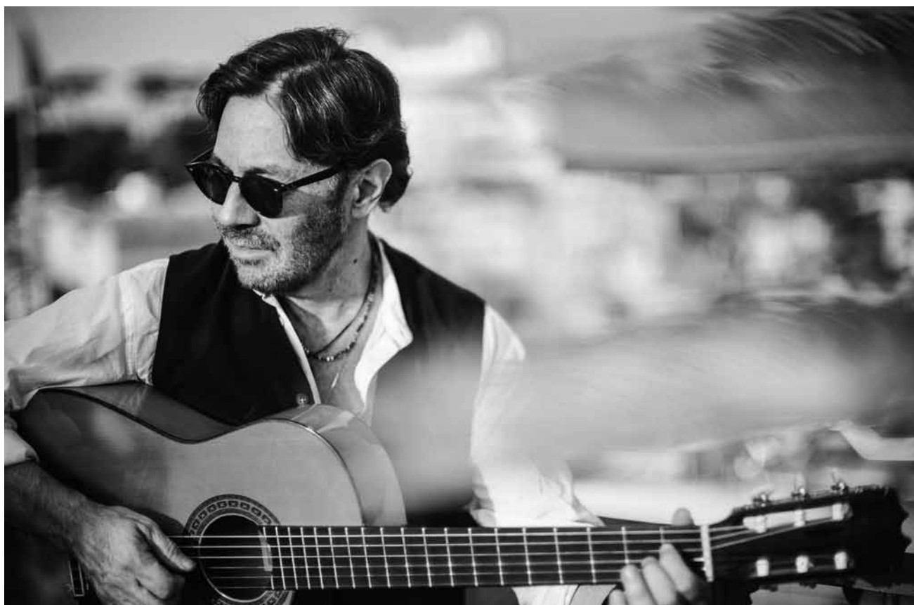
Für die etwas Sanftmütigeren: Al Di Meola tritt am 26. Mai im Theater am Ring in Saarbrücken auf.