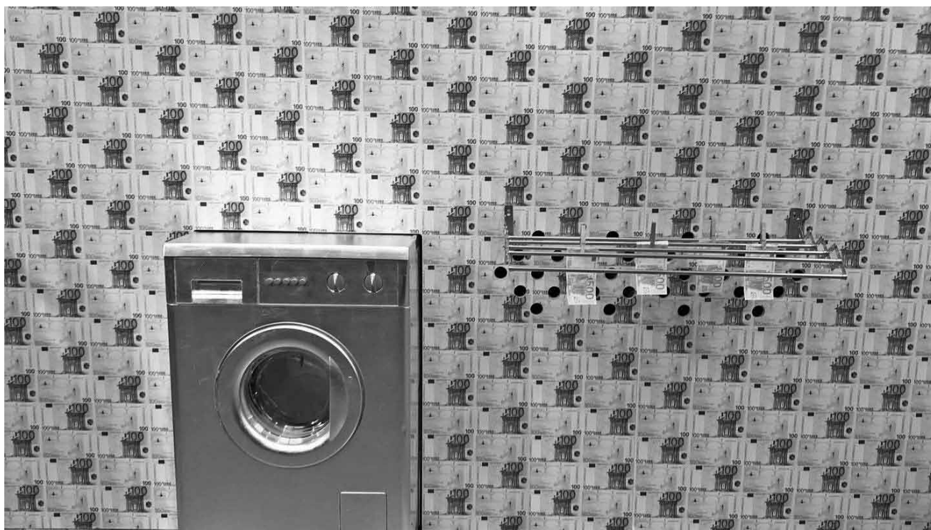
Bei Marx-Gedenken allerorts denkt man sicher sofort an „Geldrausch: Das Kapital ruft zum großen MoneyFest!“ - Thementausstellung in der Tufa Trier bis zum 5. August.