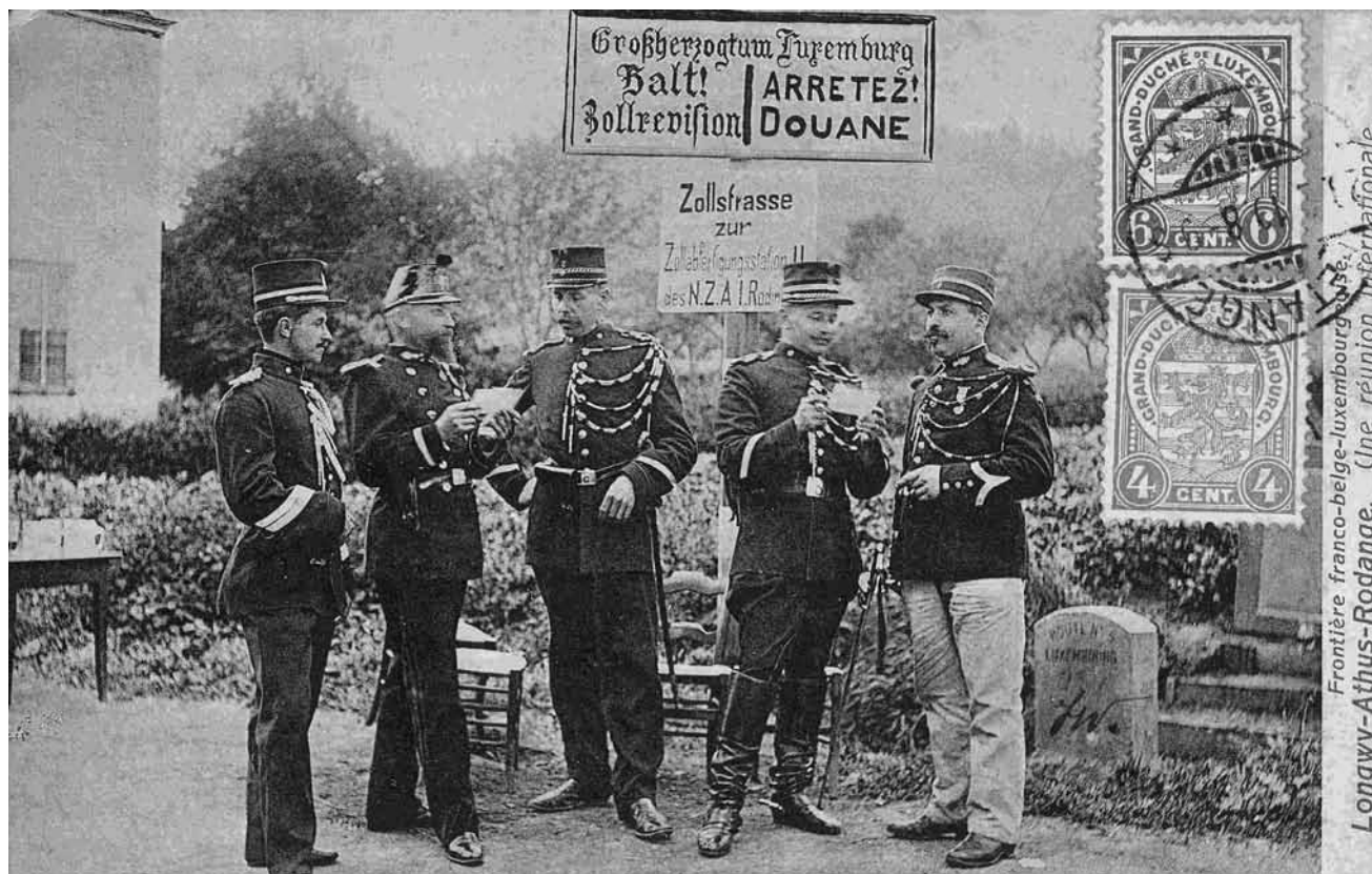
Wat „Lëtzebuerg am däitschen Zollverein 1842 - 1918“ sou gezwaft huet, dat gitt Der nach bis den 18. August an de Staatsarchive gewuer.

Dans le cadre des semaines de sensibilisation aux besoins spécifiques.