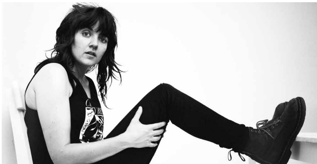
Elle vient de loin : la chanteuse australienne Courtney Barnett sera à l'Atelier le 10 juin.