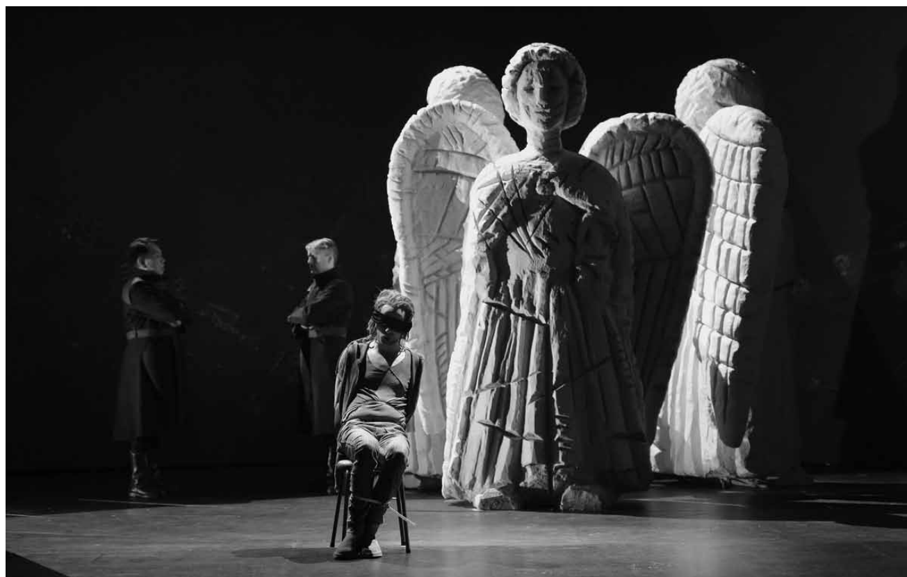
Basierend auf einem Text von Oscar Wilde ist „Salome“ von Richard Strauss eine der ersten Literaturopern – zum vorletzten Mal zu sehen am 3. Juni im Saarländischen Staatstheater.