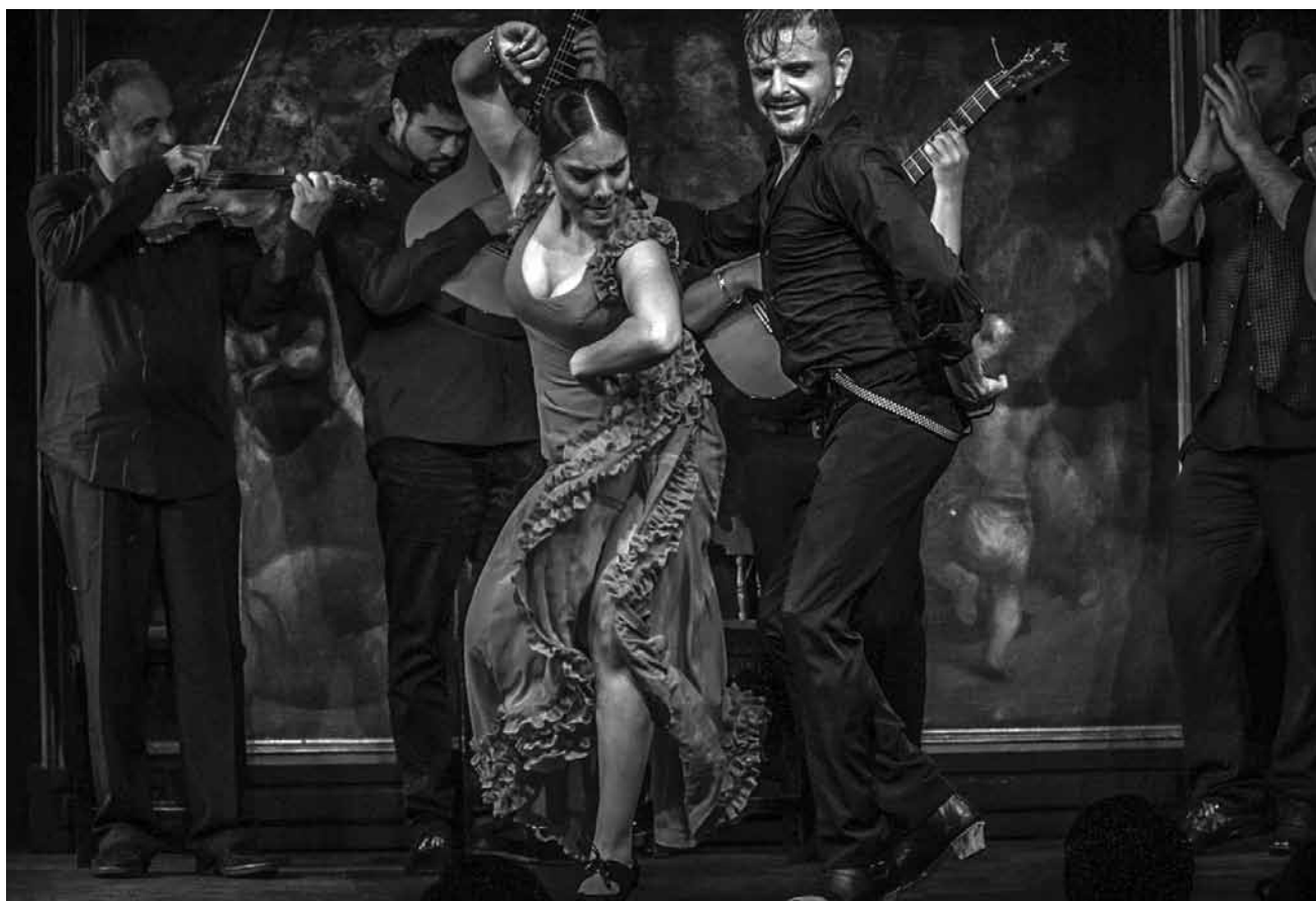
Le festival du flamenco est de retour à la Kulturfabrik ! Avec entre autres « En Estado Pura » de la compagnie Albade, le 8 juin.

Das Wunder um Verdun , szenisch-musikalische Annäherung an das Theaterstück von Hans Chlumberg, inszeniert von Gustav Rueb, Alte Feuerwache, Saarbrücken (D), 19h30. Tel. 0049 681 30 92-486. www.staatstheater.saarland