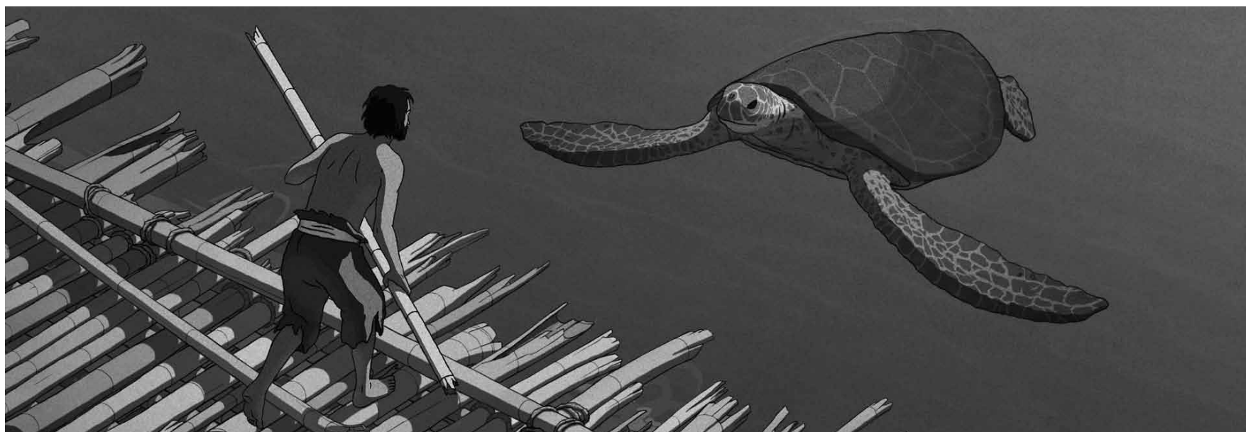
Petit bijou d'animation pour toutes et tous, au rythme contemplatif et apaisant, « La tortue rouge » émergera à la Cinémathèque le 17 juin.

Bouvier Douglas Quaid se sent appelé à aller plus loin. Il aimerait aller sur Mars, mais sa femme Lori est contre. Un jour, Quaid voit une publicité pour une agence de voyages. Elle promet un voyage parfait sans que le client ait jamais été sur place. Quaid va et veut se souvenir d'un séjour sur Mars en secret. Mais l'opération tourne mal et soudainement, l'entreprise veut la vie de Quaid.