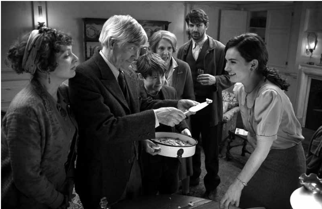
Pour être membre d'un cercle littéraire anglo-normand, il faut parfois faire quelques sacrifices culinaires.