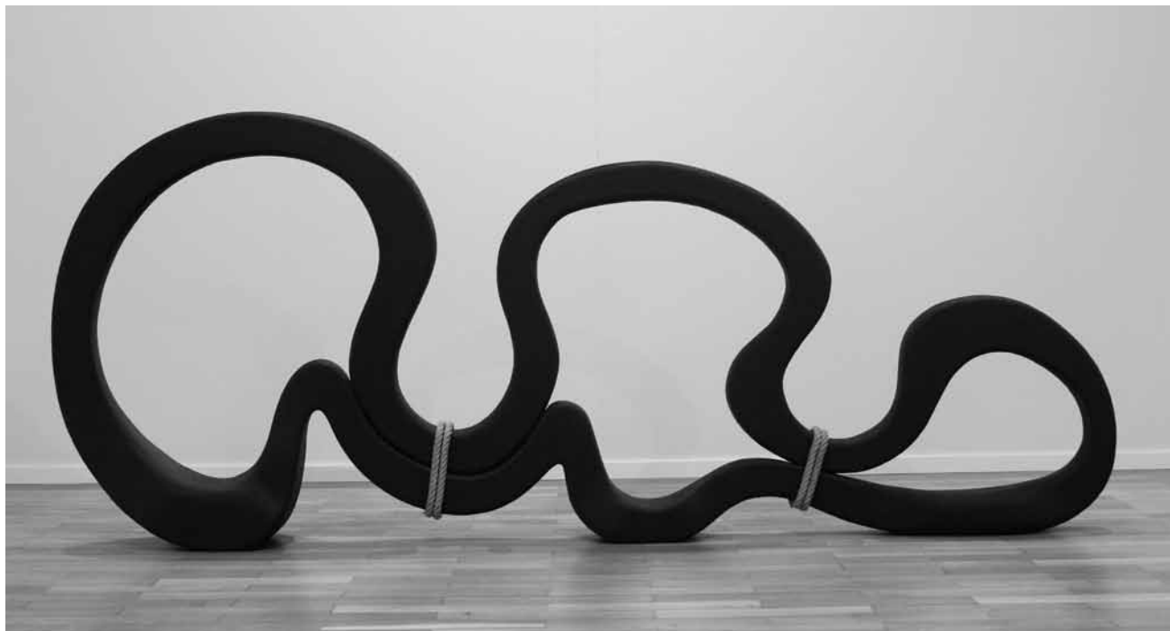
Les sculptures de Seji Kimoto sont plus que captivantes : « L'ombre des hommes » est à voir jusqu'au 2 septembre au lavoir du parc Wendel à Petite-Rosselle en France.