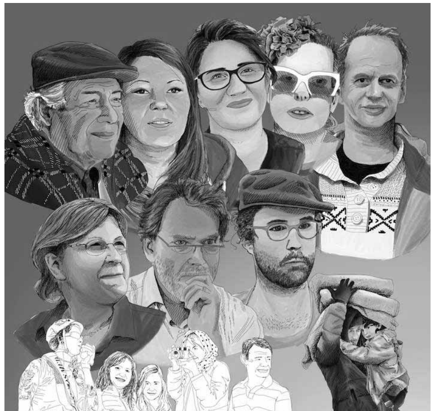
« Passeurs d'humanité » va à la rencontre de ces personnes qui - au risque de se retrouver au tribunal - n'ont rien perdu de leur humanité et décident d'aider les migrant-e-s qui atterrissent en Europe. Le 18 juin à 19 heures à l'Utopia.