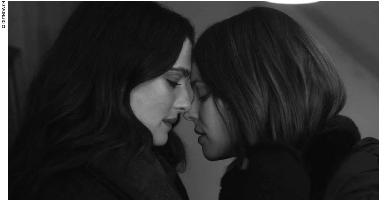
Ronit (Rachel Weisz) und Esti (Rachel McAdams) dürfen ihre Gefühle füreinander nur im Verborgenen ausleben.