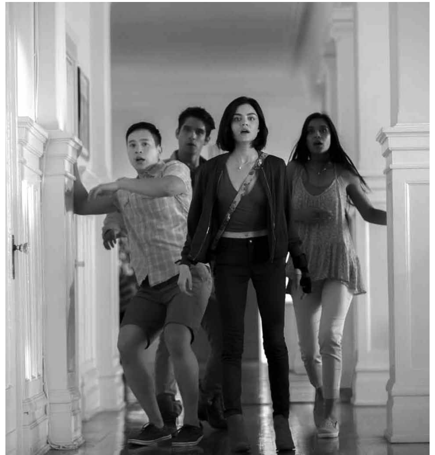
Ein altes Teenager-Mutspiel erhält ganz neue Dimensionen in „Truth or Dare“ - neu im Kinepolis Belval und Kirchberg.

Als die deutschen Truppen 1942 auf dem Vormarsch nach Paris sind, gelingt es Georg, rechtzeitig nach