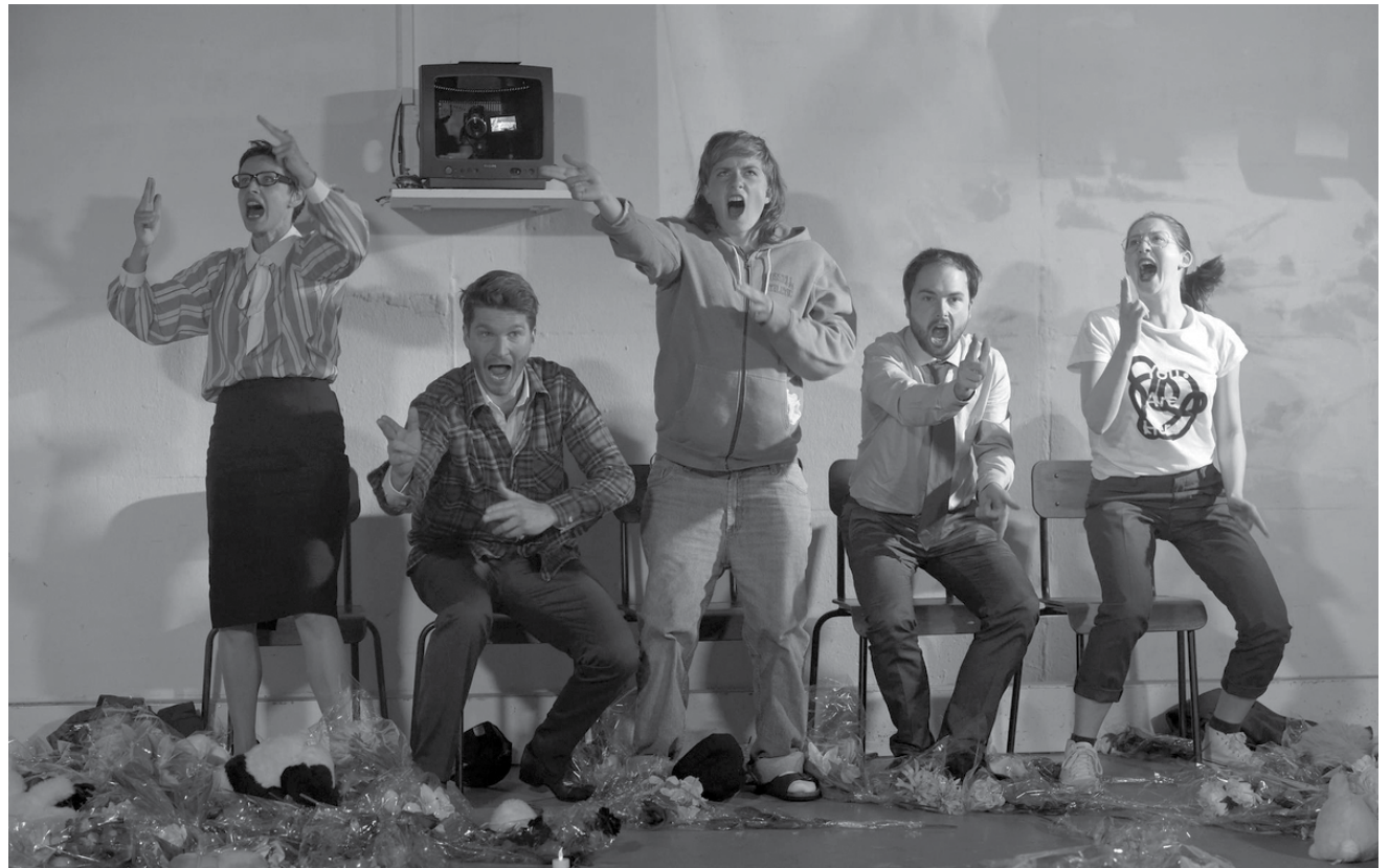
Jetzt übernehmen die Fake News auch noch die Theaterbühne: „Fake Reports“ von Katrin Röggl am 15. und 16. Juni in der sparte4 in Saarbrücken.