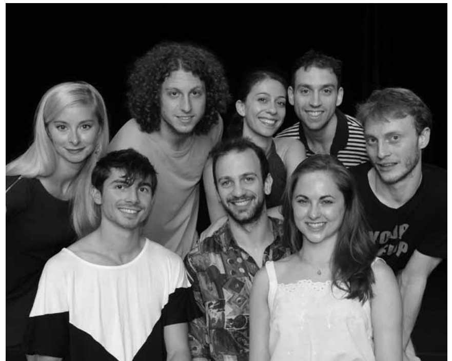
Am 15. Juni geht es in der Alten Feuerwache in Saarbrücken um die „SubsTanz 18“ – das letzte Stück der Saison wird den Tänzer*innen selbst überlassen.