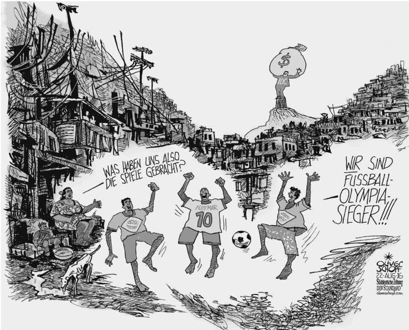
Ob Deutschland wohl noch lange über Fußball lachen kann? Im Deutschen Zeitungsmuseum in Wadgassen sicherlich: „König Fußball. Karikaturen vom Anstoß bis zum Abpfiff“ – bis zum 15. Juli.