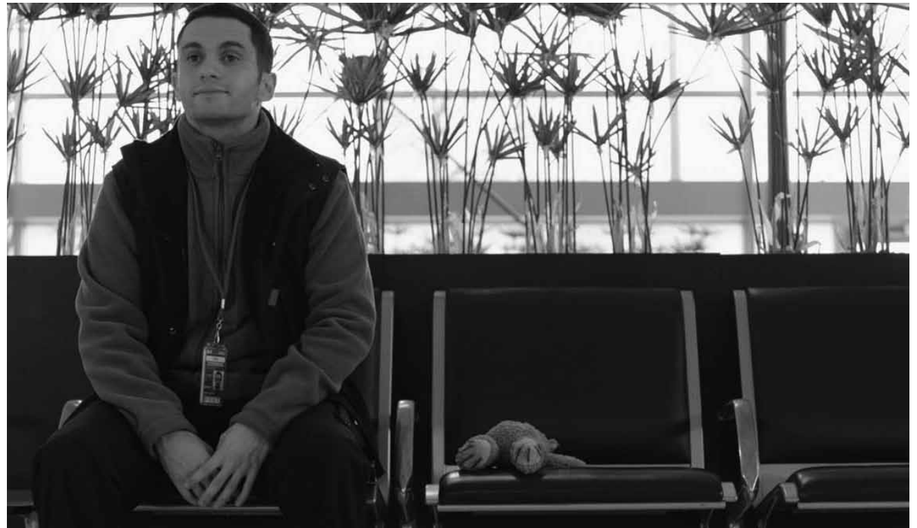
Quand la recherche d'un doudou mène à... encore une comédie française à la noix : « Le doudou », nouveau au Kinopolis Kirchberg.