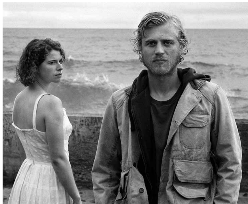
Im Familiengefängnis bleiben oder mit einem potentiellen Serienmörder durchbrennen? Diese Wahl stellt sich in „Beast“ - neu im Utopia.

NEW GB 2018 von Michael Pearce. Mit Jessie Buckley, Johnny Flynn und Geraldine James. 107'. O.-Ton + Ut. Ab 16.