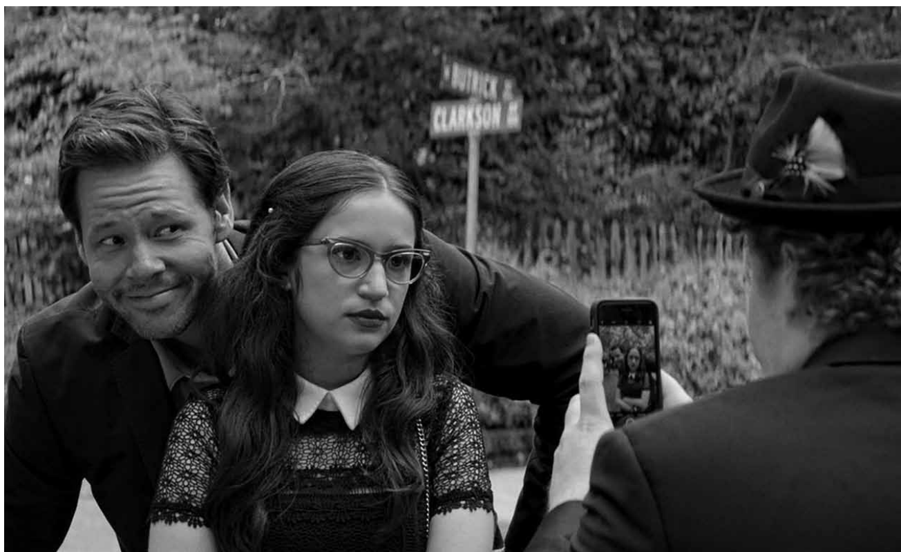
Wenn Eltern zu Kontrollfreaks werden: „Blockers“ neu im Kinepolis Belval und Kirchberg.