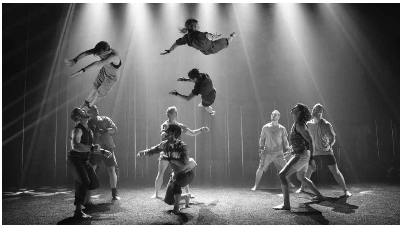
Da braucht man effektiv viel Rückgrat: „Backbone“, Zirkus am Puls der Zeit - am 27. Juni im Amphitheater Wiltz.

et Seja Rockel, avec les élèves de l'activité « théâtre », lycée Ermesinde, Mersch , 19h30. Tél. 26 89 00. www.lem.lu Réservation : booking@lem.lu