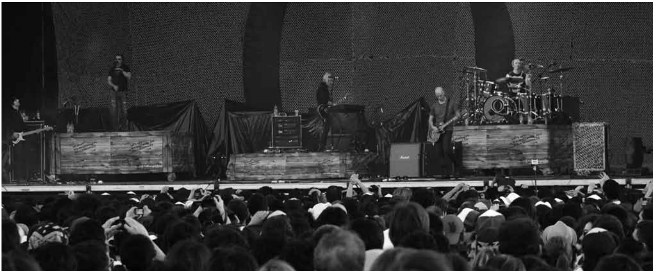
Eine allzu seltene Erscheinung: A Perfect Circle.