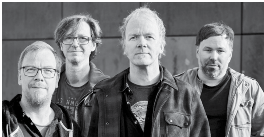
Indie Folk mit amerikanischem Touch bringen „Someday Jacob“ an diesem Samstag, dem 24. Juni in den Schlossgarten Saarbrücken.