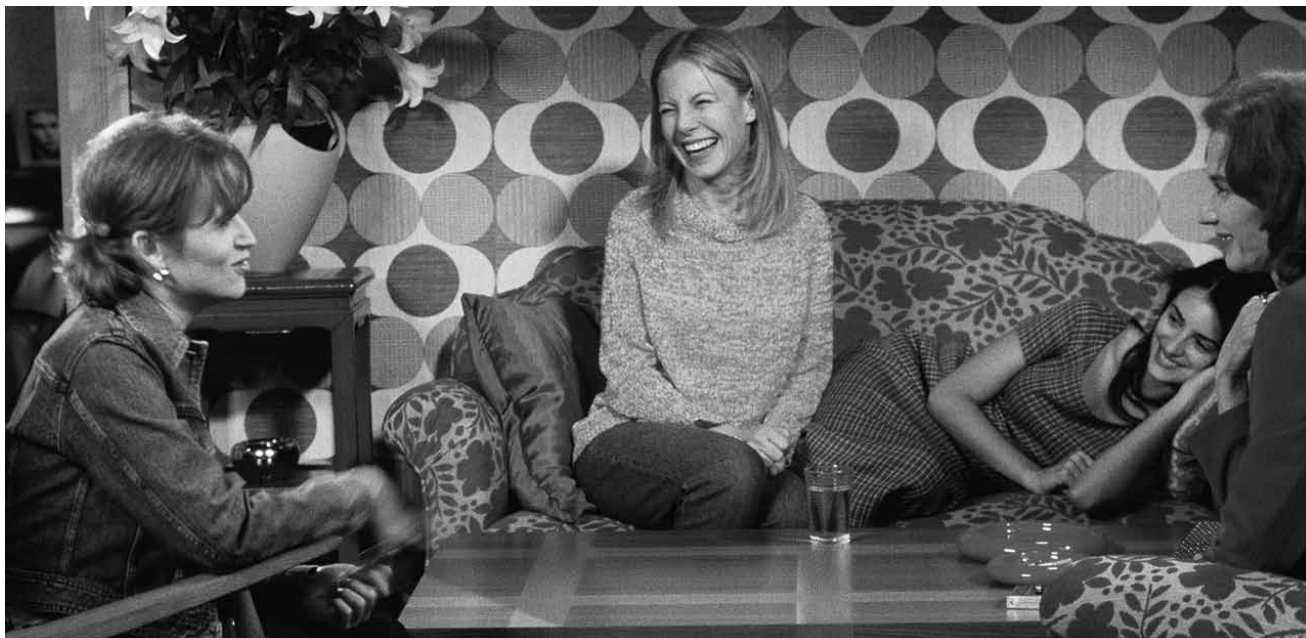
Le temps où Almodóvar n'était pas encore d'un ennui profond : « Todo sobre mi madre » - ce vendredi 29 juin à la Cinémathèque.

in den Krieg ziehen. In New York City, wo er sich der Musterung unterziehen soll, trifft Claude auf eine Gruppe von Hippies, deren Lebensart ihn sofort fasziniert.