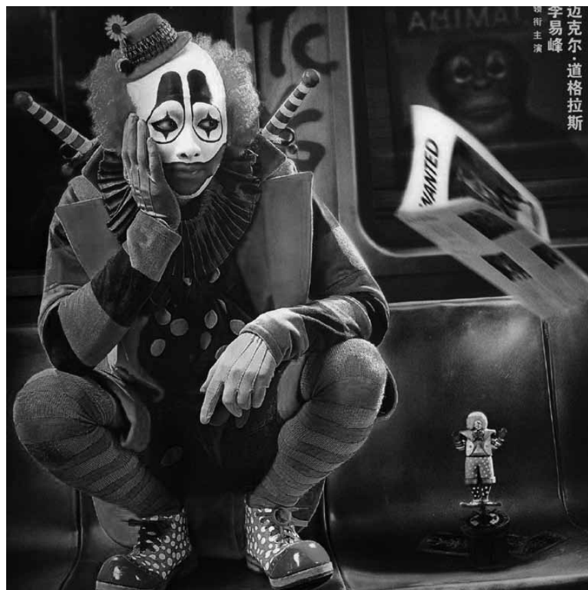
Michael Douglas wagt den Sprung ins chinesische Action-Kino: In „Dongwu shijie“ bekämpfen sich Krieger-Clowns und andere Monster - am 29. Juni im Kinopolis Belval und am 30. Juni im Kinopolis Kirchberg.