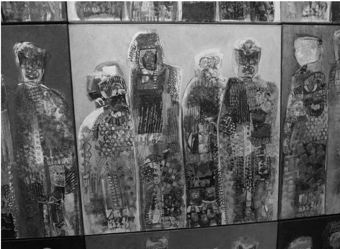
Détail du polyptyque « Multiplécité ».