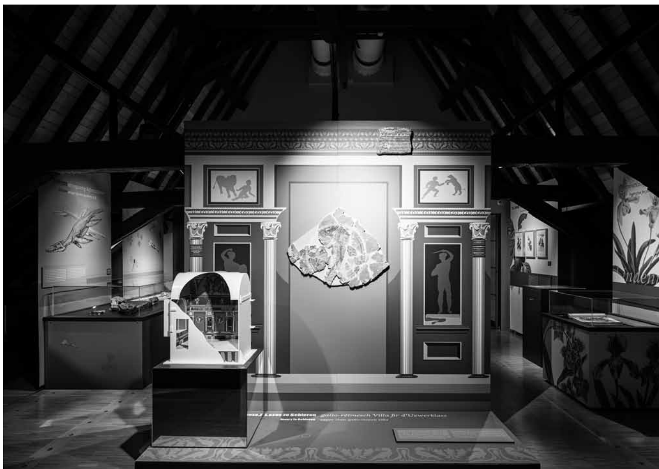
Du bric-à-brac inattendu : « Unexpected Treasures » - à voir au Musée national d'histoire naturelle jusqu'au 26 août.