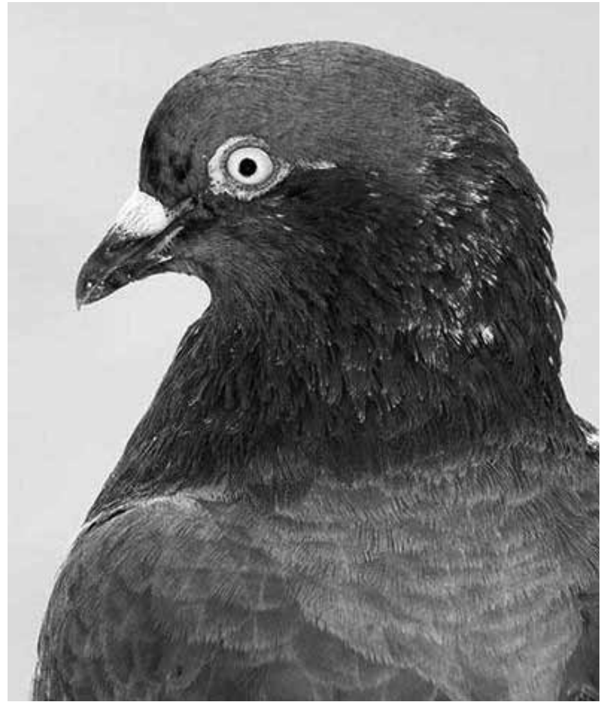
Être citoyen, c'est aussi être le pigeon de quelqu'un d'autre : « Citizen », les photographies de Mårten Lange, sont au jardin de Lélise à Clervaux jusqu'au 12 avril 2019.