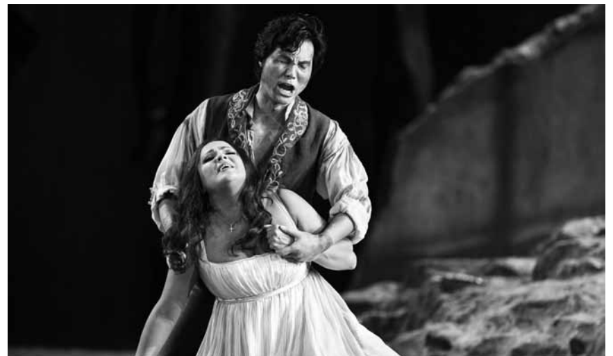
Oh well: She obviously doesn't love him, so he ... sings all the time - "Il trovatore", the opera by Giuseppe Verdi is at the Utopia on the July 7th.