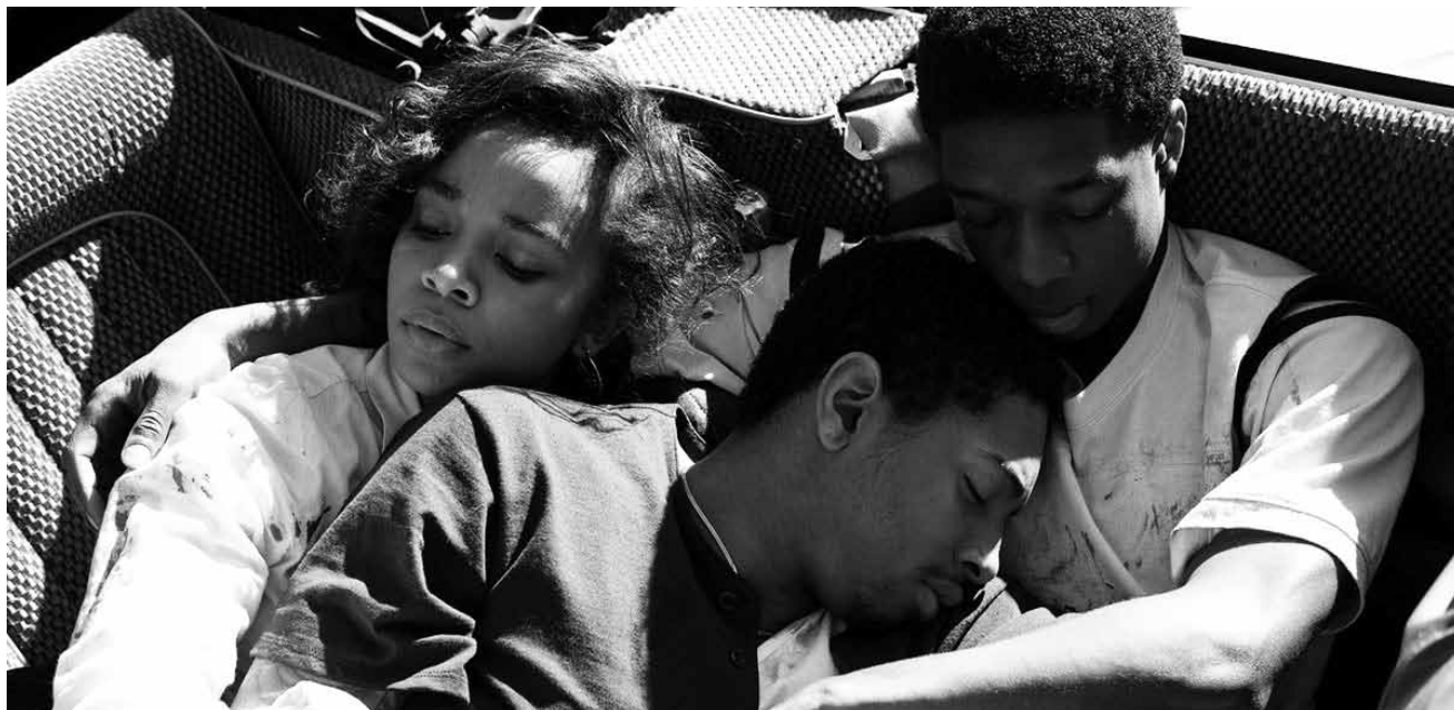
Wahrscheinlich der richtige Film zu diesem Zeitpunkt: „Kings“ reflektiert die Aufstände von 1992 in Los Angeles - neu im Utopia.